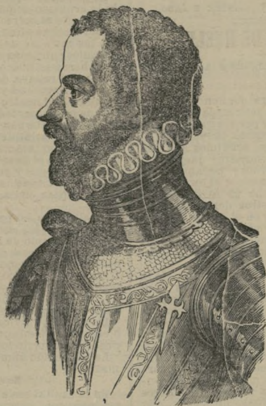
D. Alonso de Ercilla.