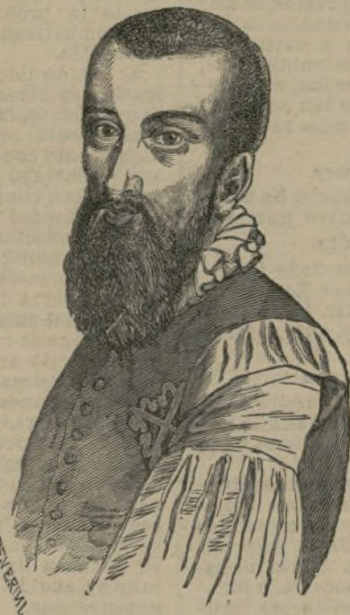
Garcilaso de la Vega.

limán, salvó a la capital del Austria, y dió a Carlos V tiempo suficiente para reunir un ejército con el cual obligó al otomano a levantar el cerco. En aquel ejército militó Garcilaso, quien llegó oportunamente para tomar parte en los encuentros habidos con la retaguardia de Solimán.