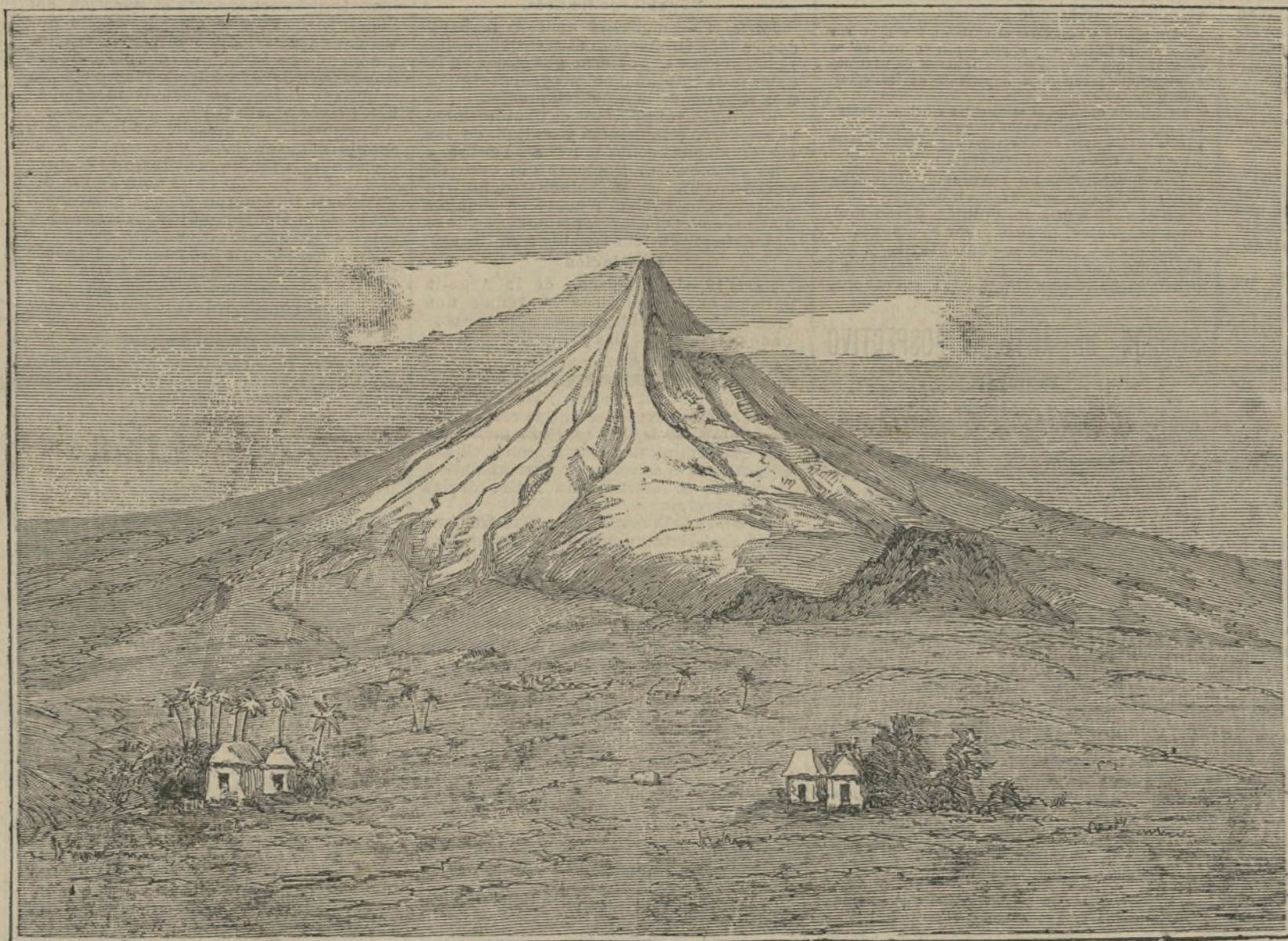
El volcán de Albay.

no surjan de la sombra las liviandades que en ella se tramaron... La celestina es en sustancia la misma, salvo el mejoramiento de la persona y del templo, las pasiones humanas tienen su ayuda en la adivina, dúctil y maleable al dinero; mas, acomodándose á los tiempos, se «establece» sin perder nada de su misérfica naturalidad... Únicamente que el pintor y el poeta la abandonan, cesando de prestarles su concurso, y queda tan sólo la hembra rufanesca registrada en los libros de la policía.