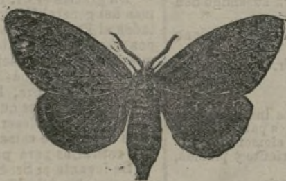
Bombix monje, mariposa hembra.

Por ahora, no podemos aún conocer el alcance de su labor política ni calcular si el foco de civilización que ha sabido mantener vivo en el Sudan llegará ó no a salvarse definitivamente de quedar apagado. Conocidos son los vastos proyectos de confederación africana que Stanley ha llevado al Congo superior: la provincia equatorial está destinada en su pensamiento a servir de base para realizarlos, y en un día no muy lejano habremos de tener los resultados de esta grandiosa concepción para cuyo éxito habrá trabajado Emin-Bajá más que ningún otro.