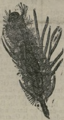
Gusano del Bombix monje en una pequeña rama de pino.