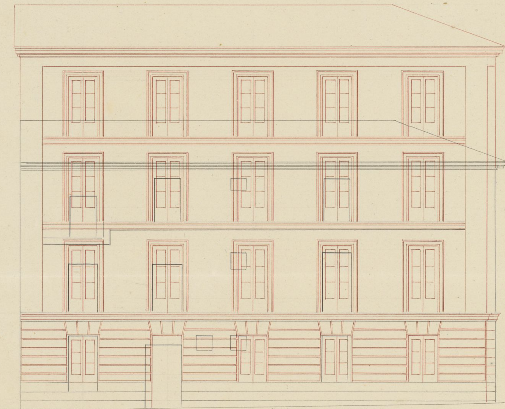
Fachada á la Calle de Sta Brígida.