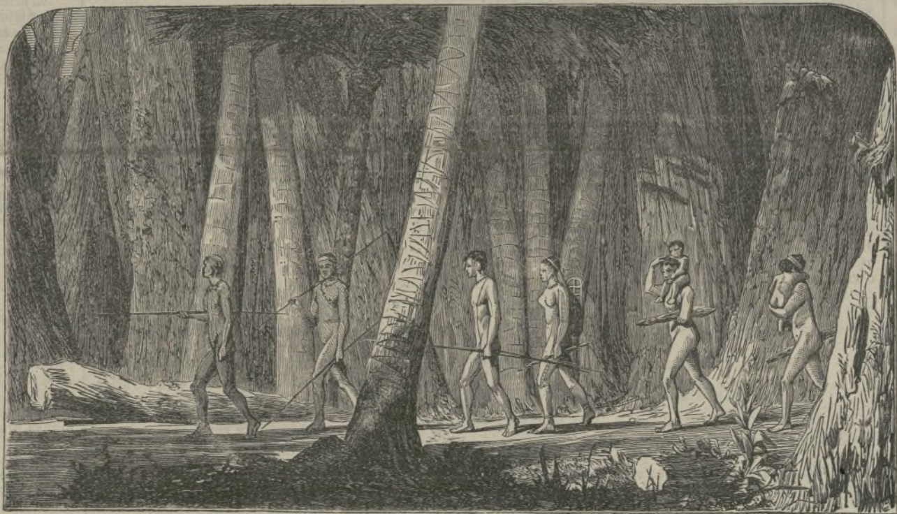
Los puris del Brasil.

Pero la temeridad rayó en demencia, cuando, de un salto, pasó de la góndola á uno de los peñascos alzados en el centro mismo de la catarata, el héroe de aquella fiesta, y á semejanza de trepadora cabra, se enroscó en lo alto á cortar de sus tallos gentiles, hermosas flores que habrían sus corolas, salpicadas de chispas de agua, á los postreros reflejos del sol de la tarde brillantadas, bajo un dosel natural de sor- prendentes efectos, y ofreciéndos en tributo de amor y como símbolo de fidelidad eterna, á su amante cón- yuge. Un grito agudísimo se escapó de la garganta de los concurrentes que desde ambas orillas del Rhin contemplaban esa operación de tamaño arriesgo, lie- vada á cabo con tan singular destreza y serenidad. Todos temblábamos como az gados en presencia de tal cosa de horrores; todos sentíamos la necesidad de prestar... diato auxilio al loco amante capaz de acometer empresa, para la cual se necesitaba, ade- más de valor y sangre fría increíbles, sentir despre- cio profundo por la vida; pero nadie fué osado á mo-