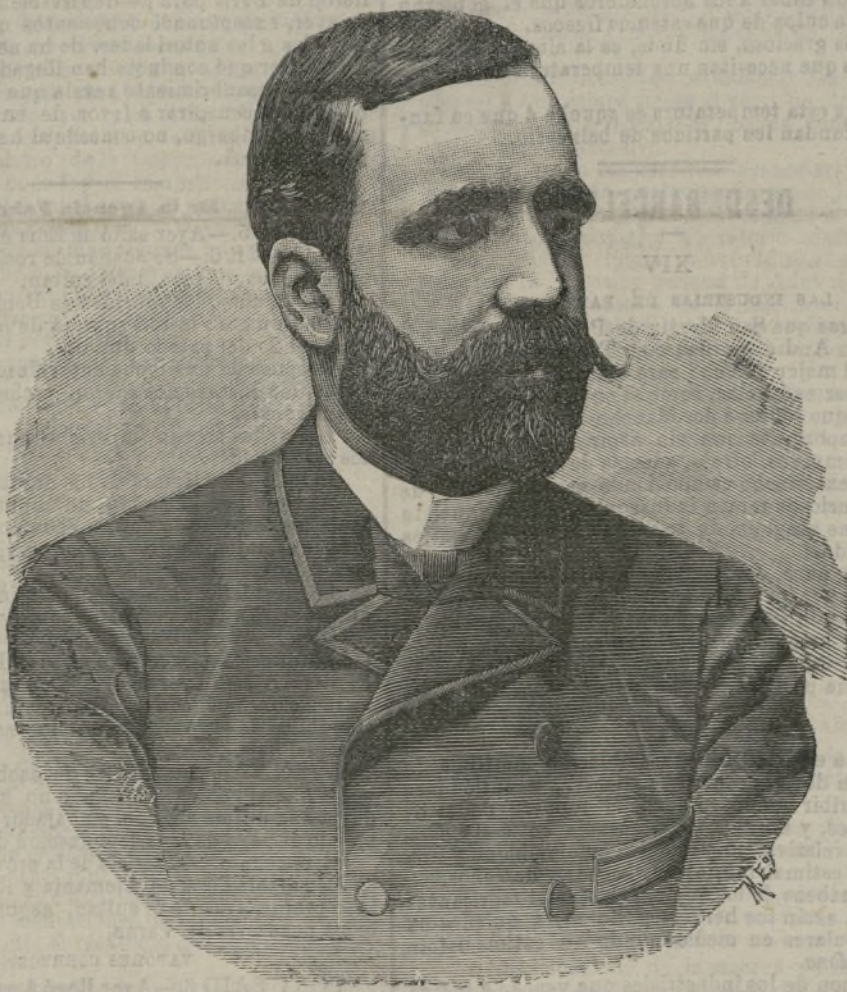
D. José Canalejas y Méndez.

No solamente no pagan contribución alguna sus habitantes, sino que todos los años reciben de la Administración municipal 140 marcos cada uno (175 pesetas) y una buena cantidad de leña para calentarse.