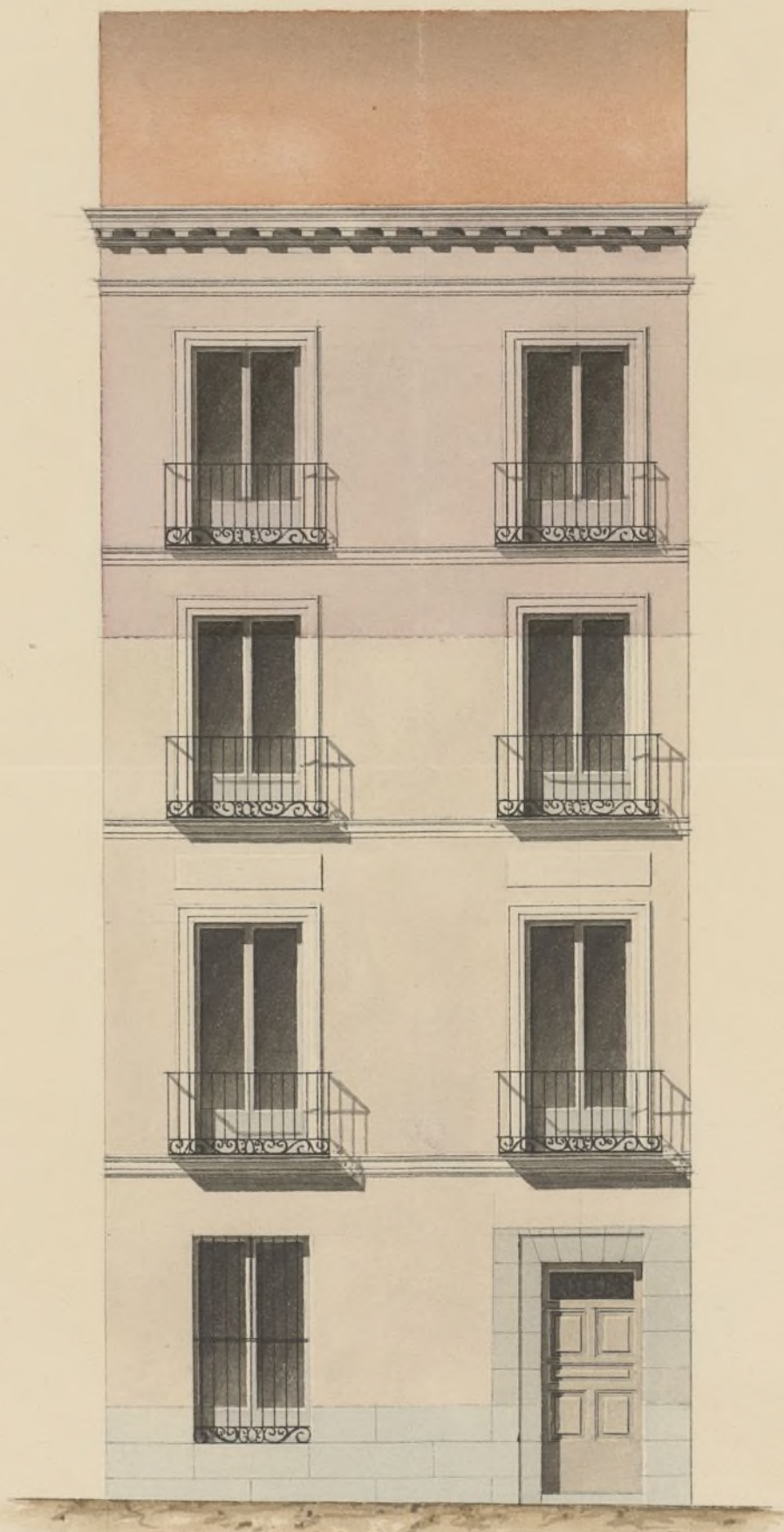
Fachada con aumento de piso tercero de la casa Núm. 5, de la calle del arco de S. ta Maria.