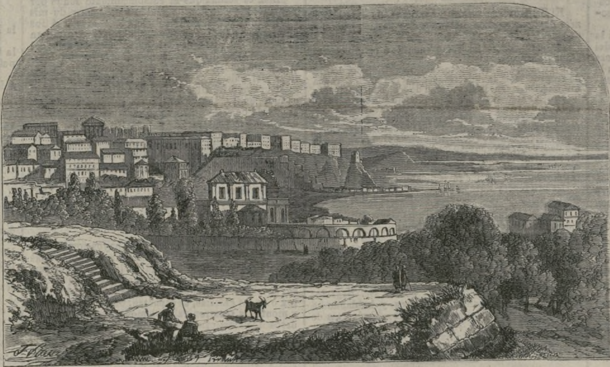
Vista de Odesa.

Sin embargo, para tranquilidad de los gastronó- mos, debemos añadir que las anguilas no tienen, como la víbora, la bota dispuesta para inocular la ponzoña, la cual, por lo demás, queda sin efecto cuando se consume la anguila como alimento; pri- mero, porque la ponzoña se destruye á una tem- peratura de 100 grados, y luego porque, como sucede con el veneno de la víbora, carece de acción sobre las vías digestivas.