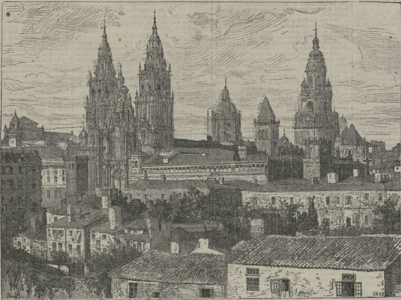
LA CIUDAD DE SANTIAGO

sus grandezas pasadas, un dichoso y muy necesario renacimiento.