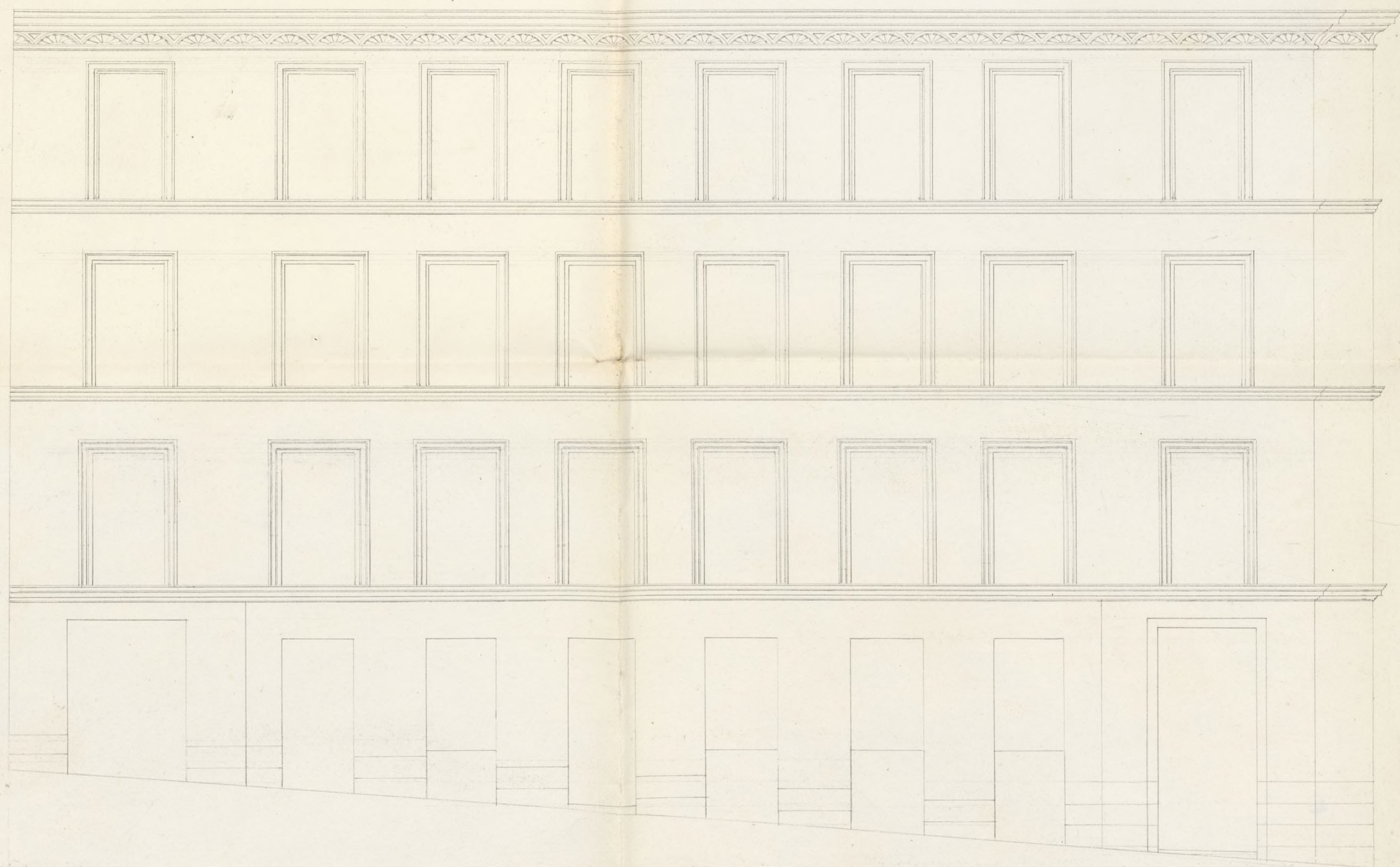
CALLE DEL OLIVO.