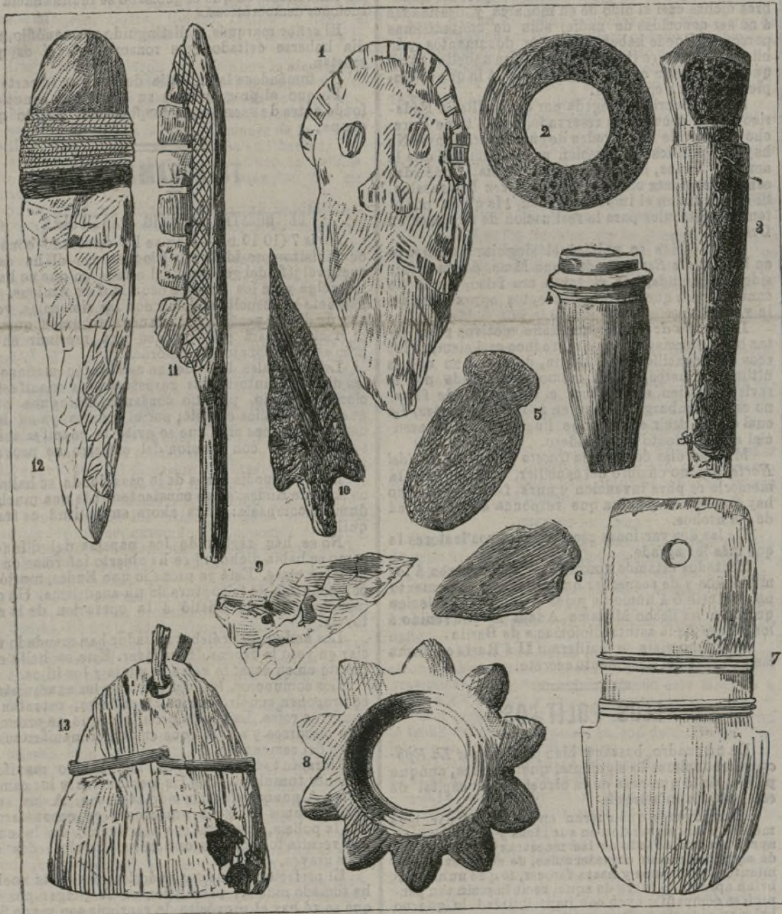
Piedras talladas en la época moderna.

Esta extraordinaria silbante ha sido invitada a lucir su habilidad en los salones más elegantes de la aristocracia inglesa. La tarifa que tiene establecida es de 500 libras esterlinas por sesión.