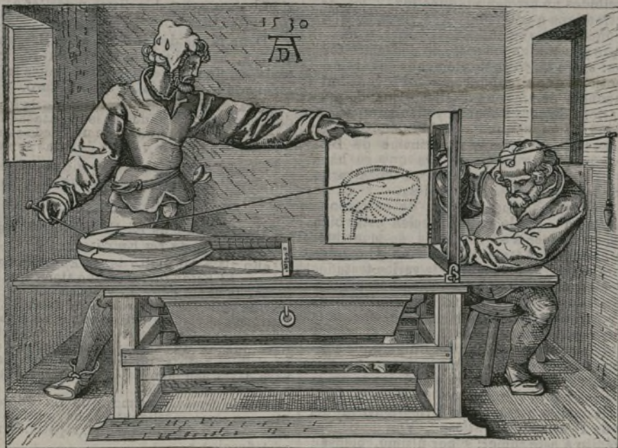
Un grabado de Alberto Dürero.