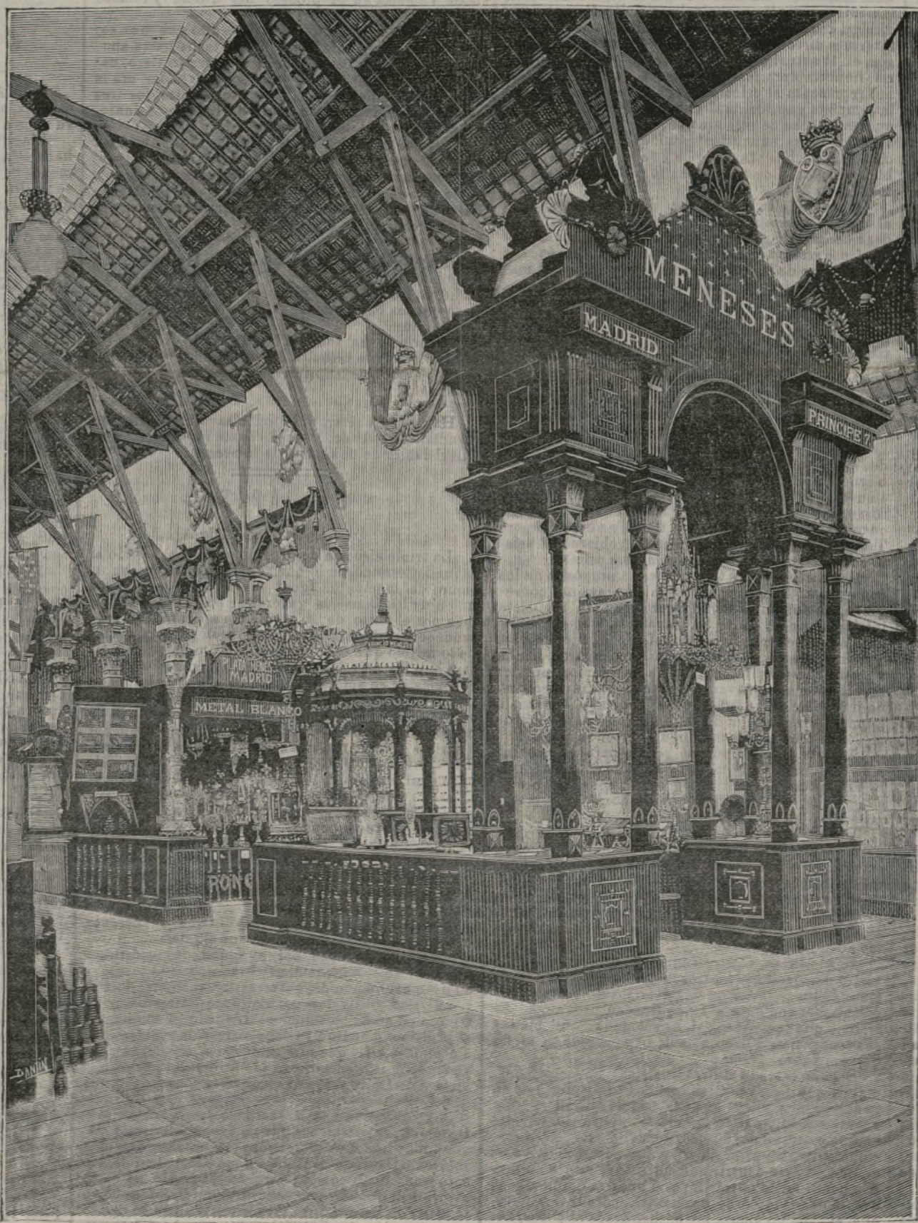
Instalacion de los Sres. Meneses.

elegantes mesas donde se exhiben los objetos de ar- te y los de fabricación especial; un mueble central suntuosamente construido en forma de octógono, que encierra los productos de fabricación corriente, y una vitrina donde están expuestos los objetos destinados al culto católico, que son igualmente de fabricación corriente.