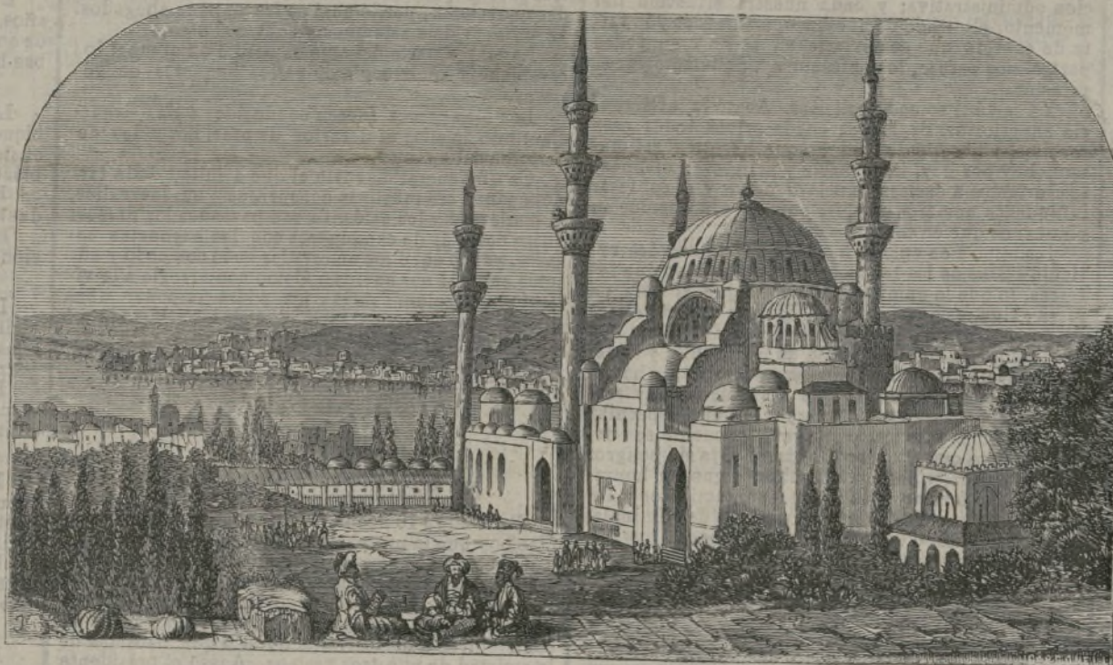
Mezquita de Soliman en Constantinopla.

Refiere el Times un hecho curiosísimo ocurrido recientemente en China, y que es realmente característico. Hay en la ciudad de Fochow un templo, en el cual se hallan expuestos á la adoración de los fieles unos ídolos, dedicados especialmente á ayudar á sus devotos en sus venganzas. La muerte reciente del comandante militar fué atribuida por el pueblo á maleficios de los tales ídolos, y el Virrey mandó formar casa á los acusados. El Gobernador, provisto de un mandamiento de prisión en toda regla, arrestó á los 15 ídolos, que eran todos de madera, y de cinco pies de altura. Antes de someterlos á juicio, el Virrey los hizo sacar los ojos para que no vieran á los jueces y no pudieran vengarse de la sentencia que se pronunciase contra ellos. Reconocidos culpables, fueron decapitados por orden del Virrey y arrojados á un estanque. El templo fué arrasado para que no pudieran nuevos ídolos venir á turbar la tranquilidad del pueblo.