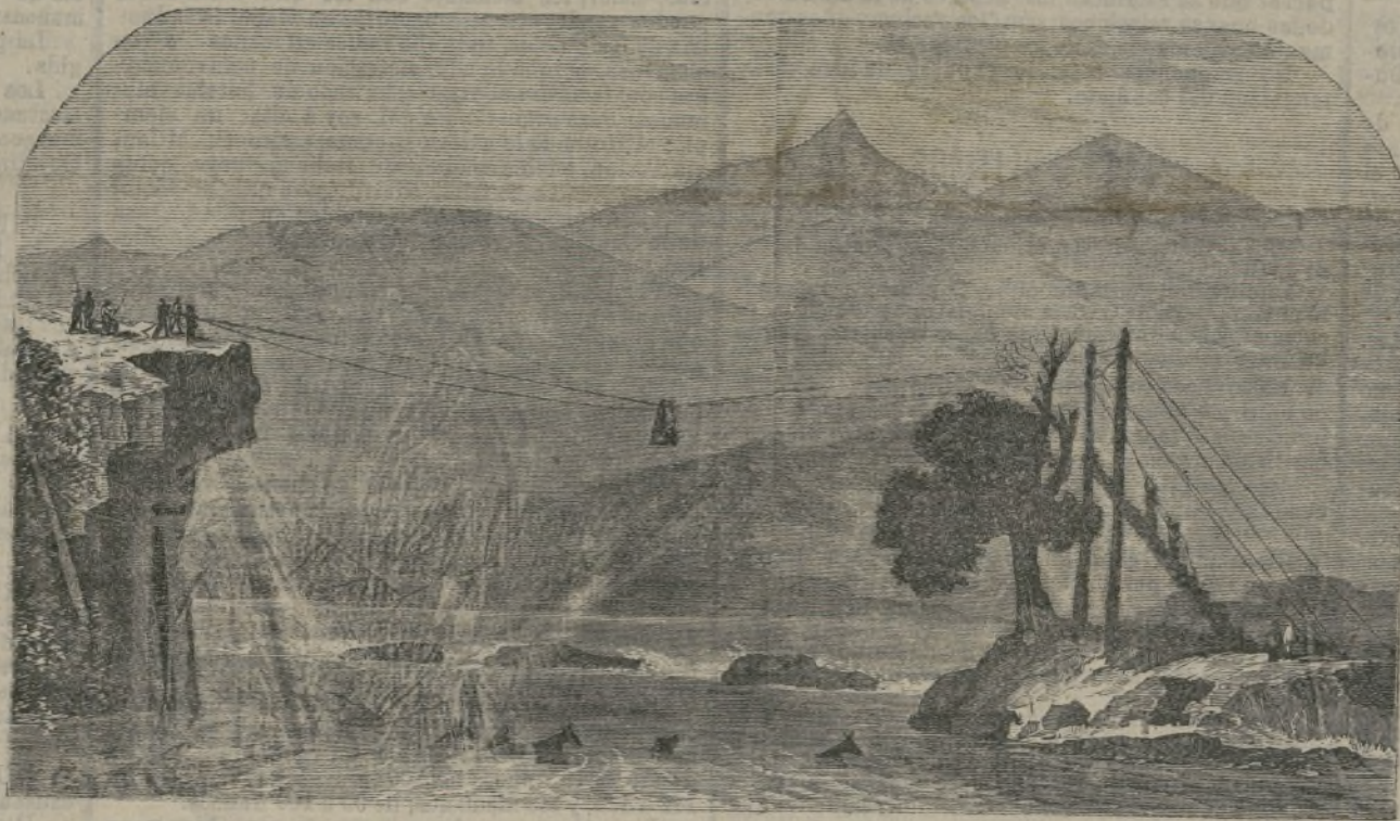
Puentes de cuerdas.