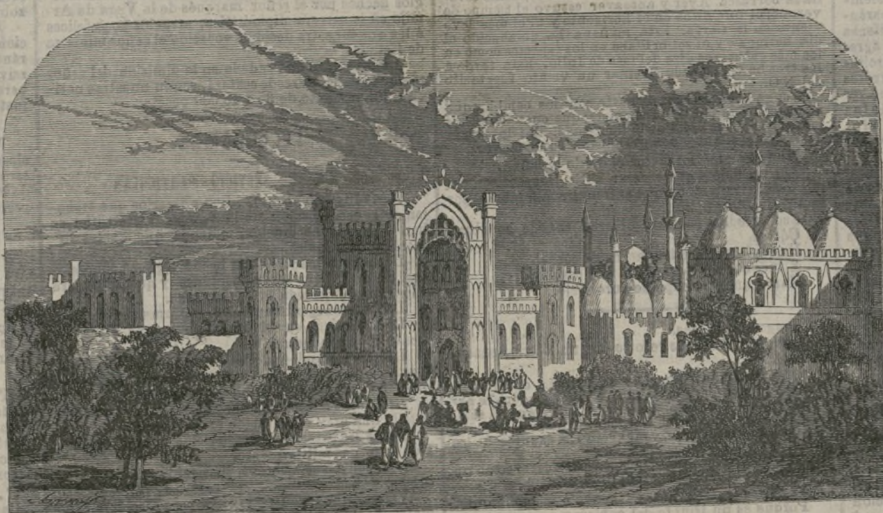
La puerta de Constantinopla en Luckuow.

Maigquez fué una verdadera personalidad en su tiempo; él fué el intérprete genuino de las grandes