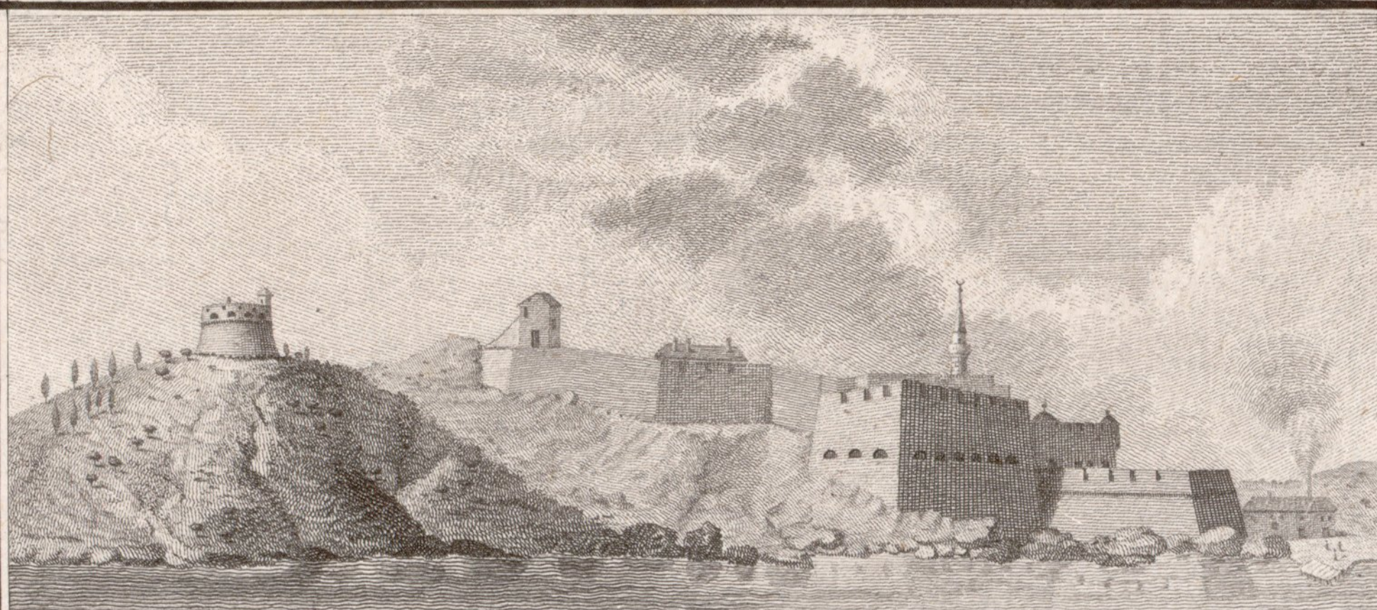
Segundo Castillo al uso moderno.