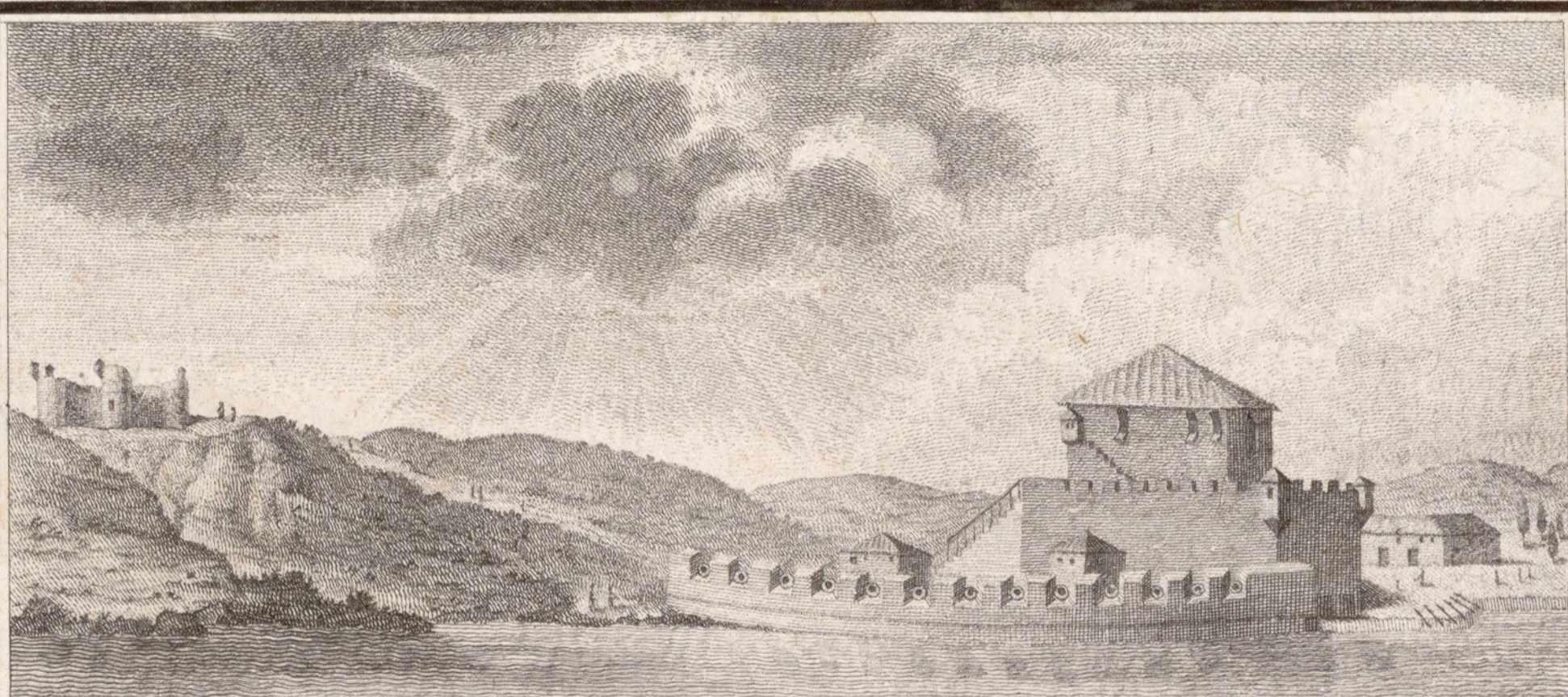
Primer Castillo del canal del Mar negro en Asia.