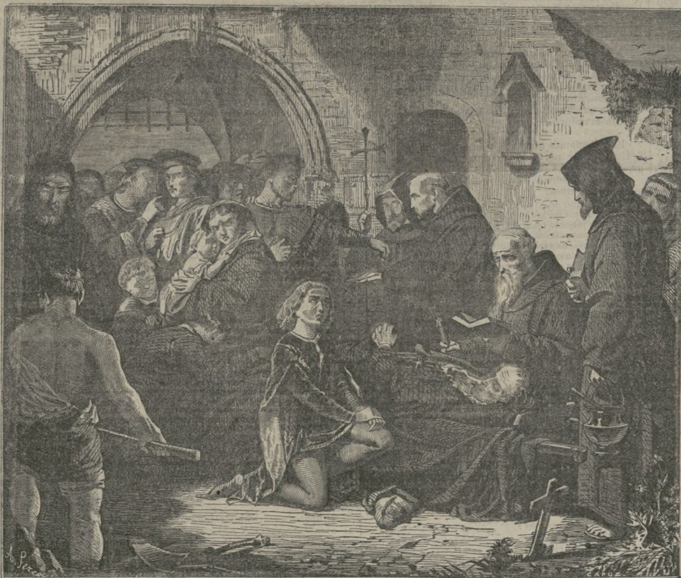
Enterramiento de D. Alvaro de Luna. (Cuadro de Cano).

En Yeddo es completamente desconocida la silba teatral. Los espectadores demuestran su disgusto poniéndose en pie y volviendo la espalda al palco escénico. Cuando ésta imponente manifestación tiene lugar, se suspende la representación y se sustituye por otra pieza. Este procedimiento oriental es más culto que los gritos y silbidos de los teatros de Madrid.