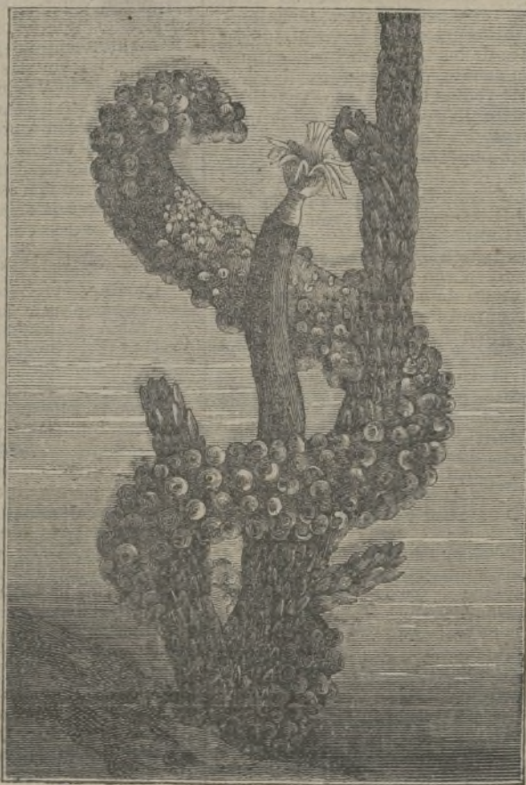
El polipo ambulante.

En último análisis, el objeto de la represión penal es desalentar y aun suprimir, tanto como sea posible, la industria del robo y del asesinato. El medio que con preferencia ha empleado hasta el presente para obtener ese resultado, ha sido la ele-