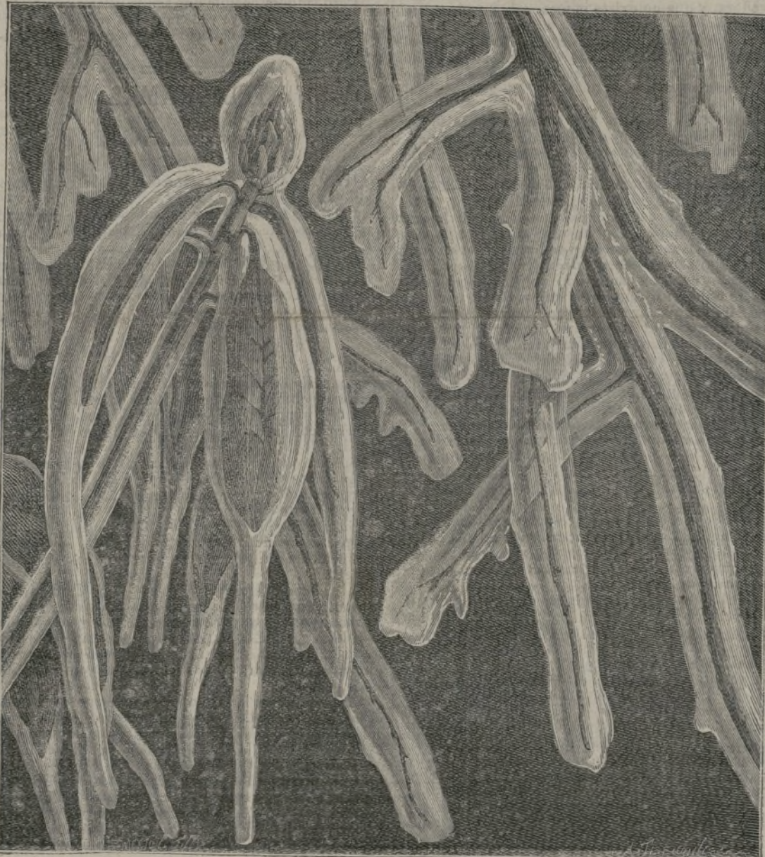
Efectos de las heladas.

Una noche de invierno, allá en Extremadura, dormía yo en el chozo con los compañeros , cuando sentí que me movían y me andaban en la cara; era el perro que lamiéndome y empujándome, hacía por despertarme. Barrunté pronto lo que esto significaba; de seguro no andaría muy lejos el lobo. Salí del chozo envuelto en la manta, con la escopeta al brazo y Pelea delante, silencioso y con el pelo encrespado. Me escondí entre las ovejas poniendo el oído y