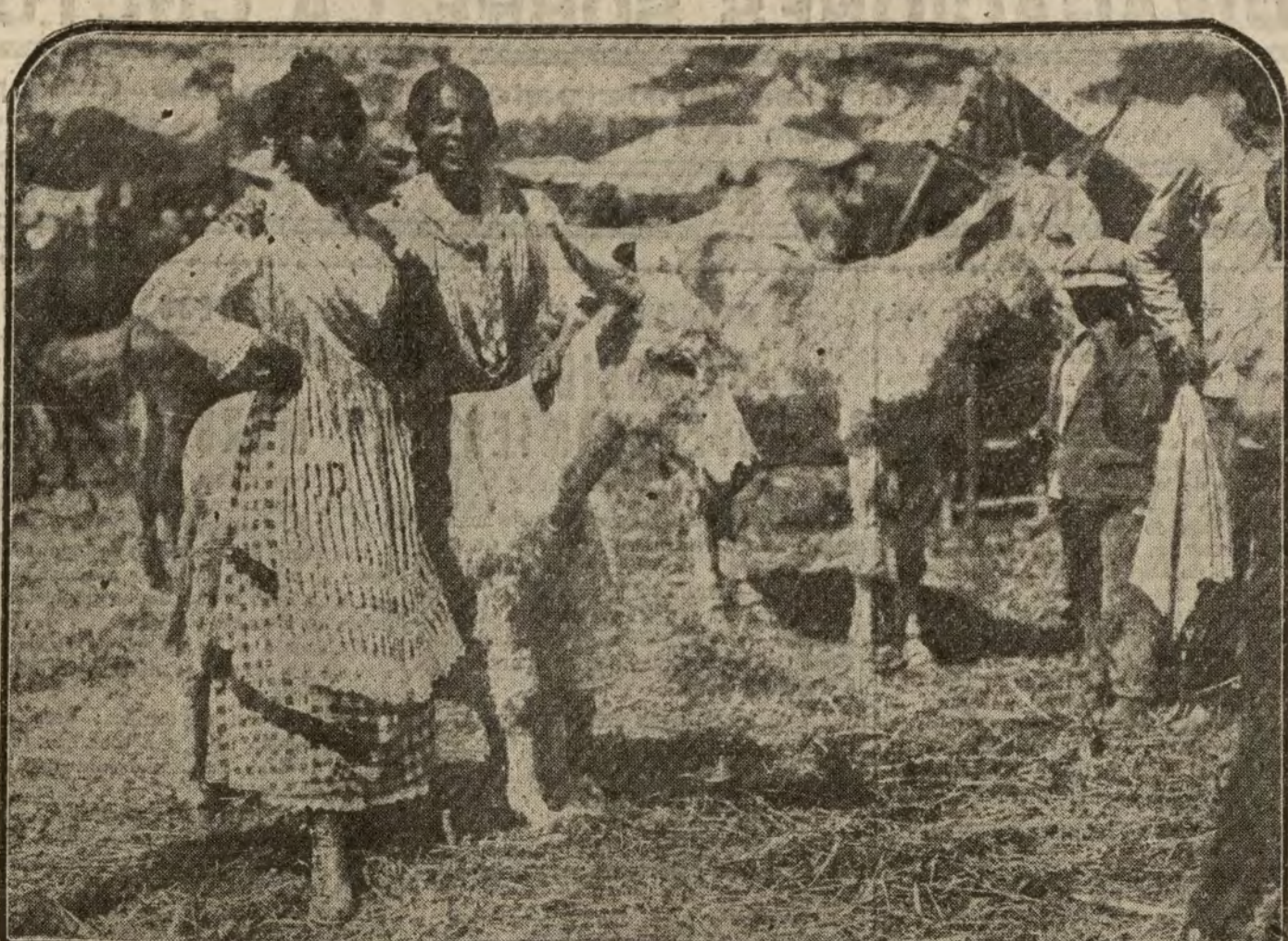
Un detalle de la feria de Sevilla.