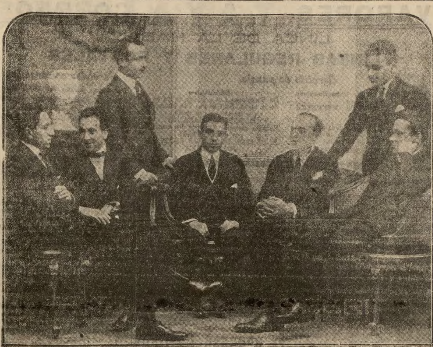
Grupo de los nuevos médicos de la Marina de Guerra española, aprobados en las últimas oposiciones.

Mañana, domingo, a las seis y media, "El amor de las estrellas"; a las diez y media, "El amor de las estrellas"; y a las diez y media, "El amor de las estrellas".