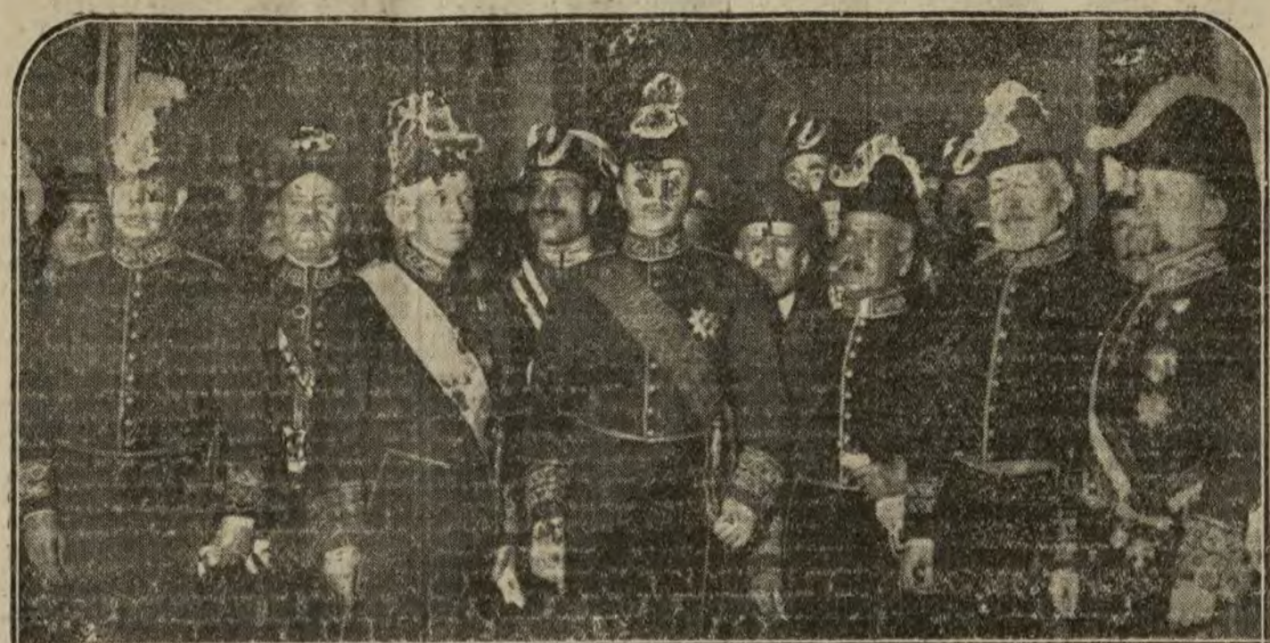
El presidente del Consejo y los nuevos ministros, al salir ayer de Palacio, después del acto de la jura.

Los naufragos estuvieron a punto de perecer, siendo salvados por la tripulación de la trainera "Nuestra Señora", del Carmen.