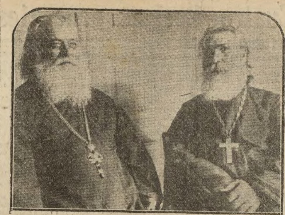
Los arciprestes rumanos del Monasterio de Orhei, de Besarabia, que se han sumado al movimiento de opinión pública que demanda la anexión de la Besarabia a Rumania.

Londres 6.—Interrogado en la Cámara de los Comunes sobre la independencia de Egipto, Bonar Law ha dicho que las diferentes declaraciones hechas por los Gobiernos sucesivos de Gran Bretaña no debían literalmente interpretarse por un compromiso que confirme la independencia de Egipto.