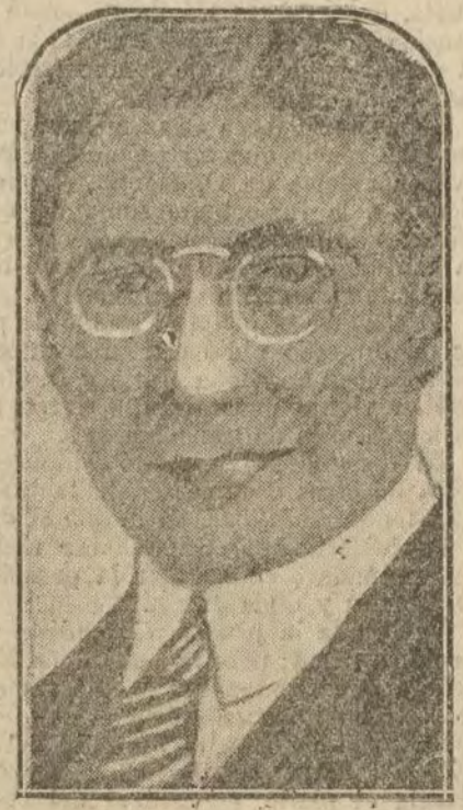
Mr. Bernard Baruch, consejero de Hacienda del Presidente Wilson, que ha hecho interesantes declaraciones acerca de las posibilidades de pago de Alemania, y de la actitud americana frente a los aliados.