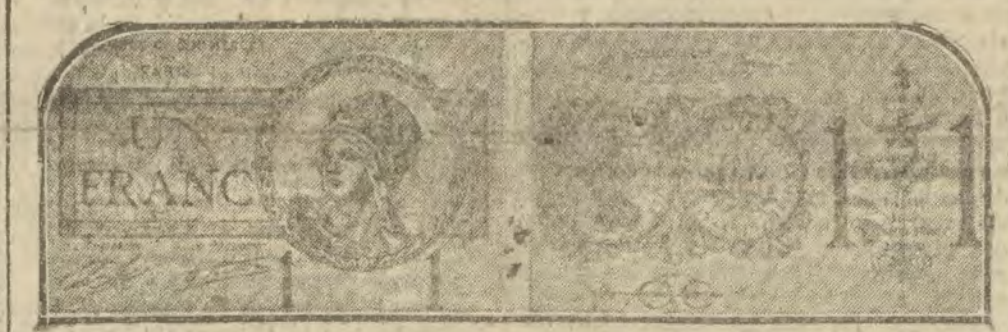
Reproducción del anverso y reverso del nuevo billete de un franco, papel moneda que circulará en Francia hasta el 1 de Julio de 1922.

Orléans 7.—Las fiestas de Juan de Arco empezarán esta noche con una solemnidad excepcional, a causa de la presencia de Foch, que ha accedido al deseo del Municipio.