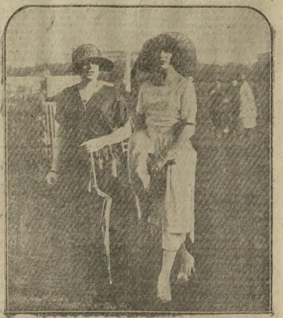
Dois elegantes madrileñas paseando por el Hipódromo, durante las carreras.