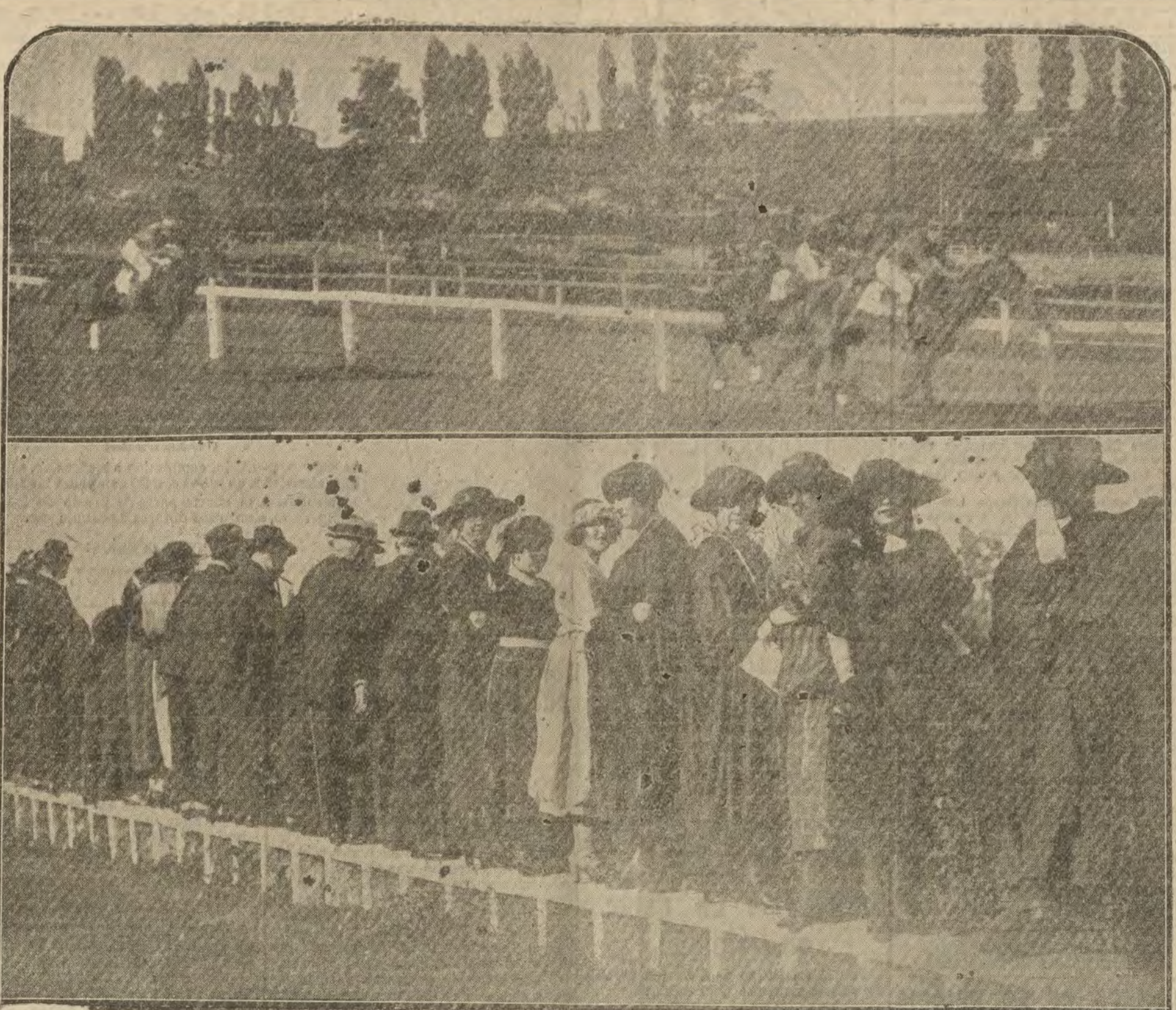
Un aspecto de las carreras de caballos celebradas ayer tarde en el Hipódromo.

El sabio académico francés M. Viotte, ha descubierto un nuevo medio para reconocer si la leche sufre alguna alteración dañosa para la salud. Se ha comprobado que la leche en estado normal se destruye los glóbulos rojos de su cuerpo de vaca al aun adicionándole tres decímetros cúbicos de un volumen de agua destilada, y que, por el contrario, la menor alteración en el nutritivo líquido tiene el poder de destruir rápidamente los glóbulos rojos. Estas experiencias, detalladamente realizadas, darán margen a muy interesantes conclusiones.