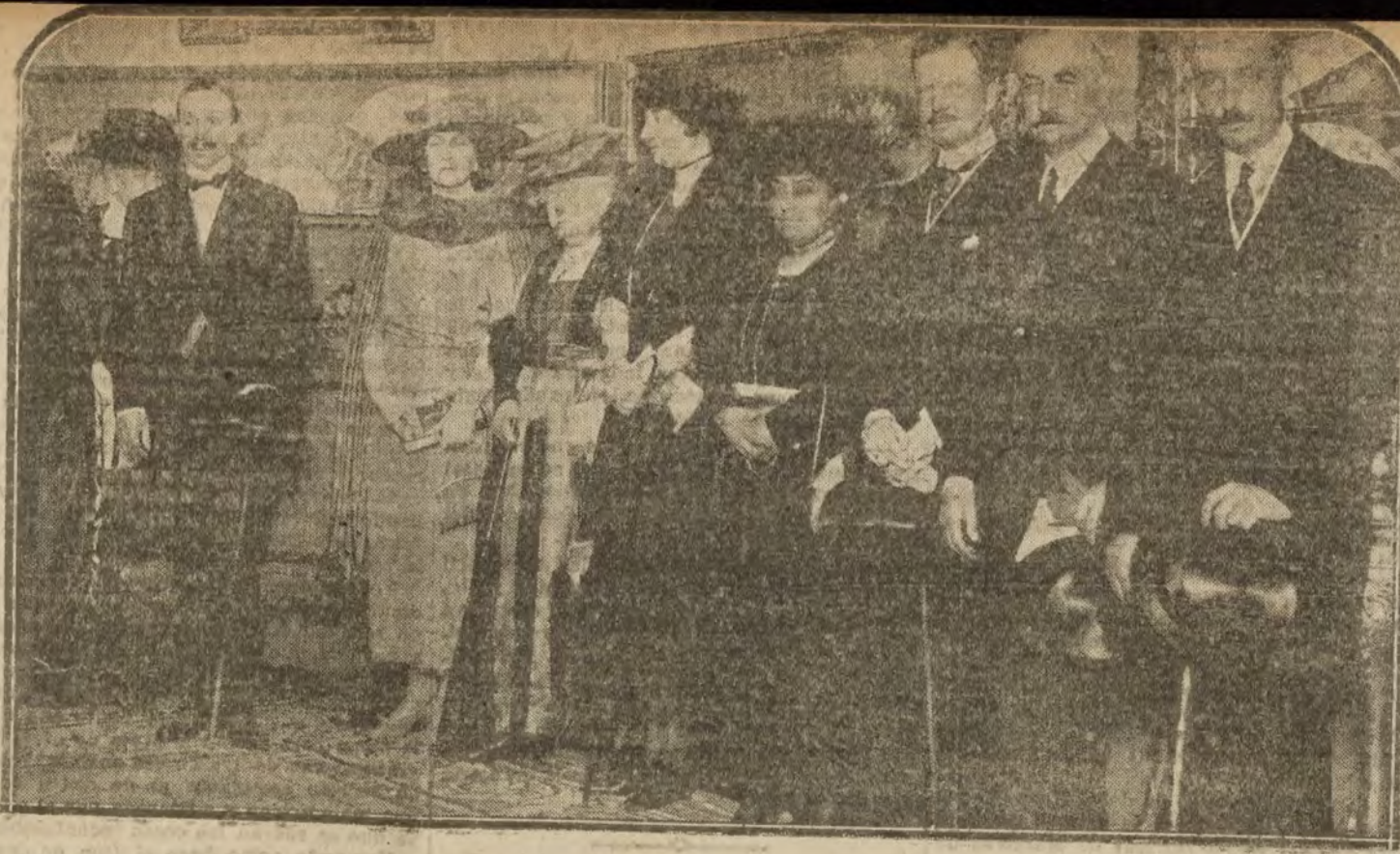
Los Reyes y los infantes inaugurando la Exposición de abanicos que los amigos del Arte han organizado en uno de los salones del Palacio de la Biblioteca.

Compra toda clase. Pago bien. Casa nueva. HUERTAS, 12. Teléfono 1.662 M.