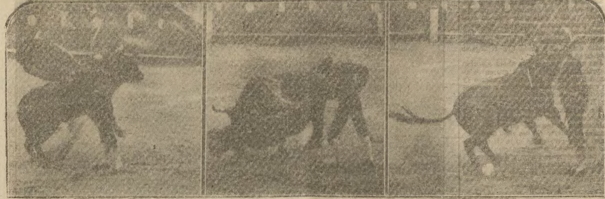
Tres momentos interesantes del "Gallo" en su primer toro.

Lances de muleta dados por un hombre, por un genio, por un maravilloso artista del toro. Nadie los niega, y por