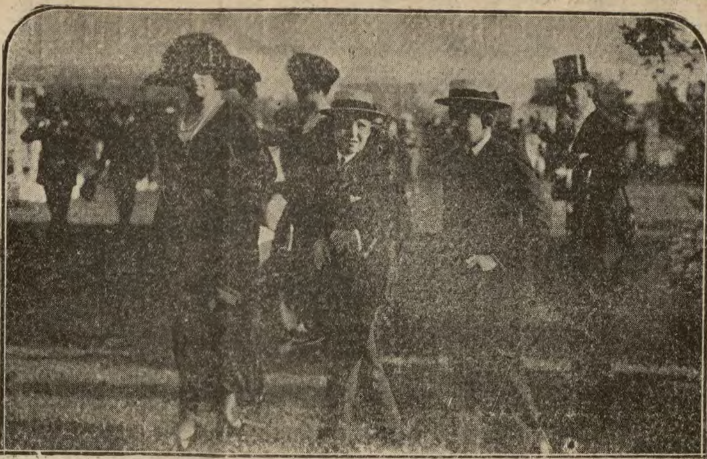
S. M. la Reina D. Victoria paseando con sus hijos, el príncipe de Asturias y el infante D. Jaime, durante las carreras de caballos verificadas ayer taris.

Da paso al recinto un camino de 110 metros de largo, rodeado por un intercolumnio de dobles arcos sobre capiteles lotiformes, que recuerdan los de las salas