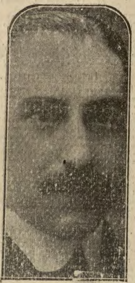
D. Carlos Cañal, primer ministro del Trabajo.