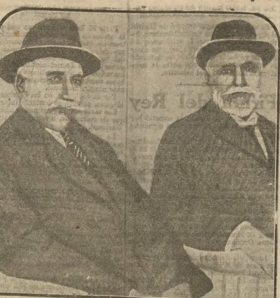
Diemil Pachá, ministro de la Gobernación en Turquía, y Tewfik Pachá, gran visir, plenipotenciarios otomanos que, en representación de la Sublime Puerta, han llegado de París para firmar el Tratado de paz franco-turco.