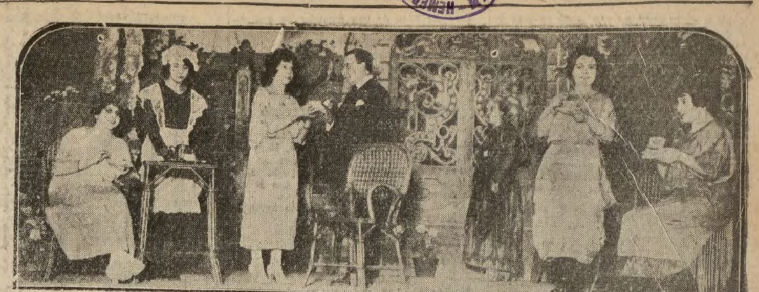
Una escena de la obra "Jaulas de Oro" que se estrenó anoche en Cervantes.