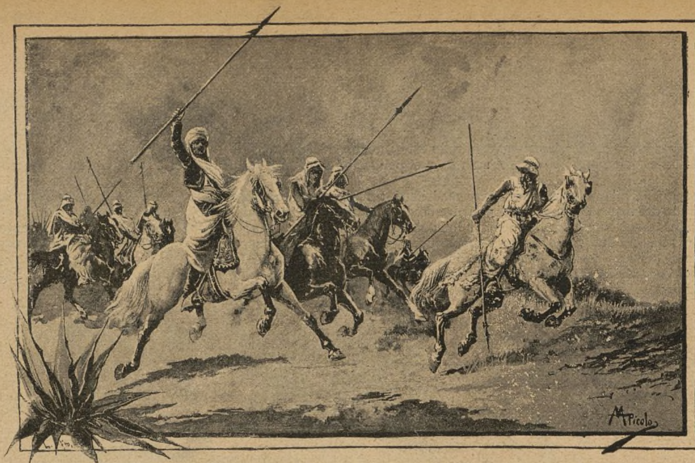
LOS MOROS QUE PRECEDEN Á LA EMBAJADA ESPAÑOLA EN SU VIAJE Á LA RESIDENCIA DEL SULTÁN