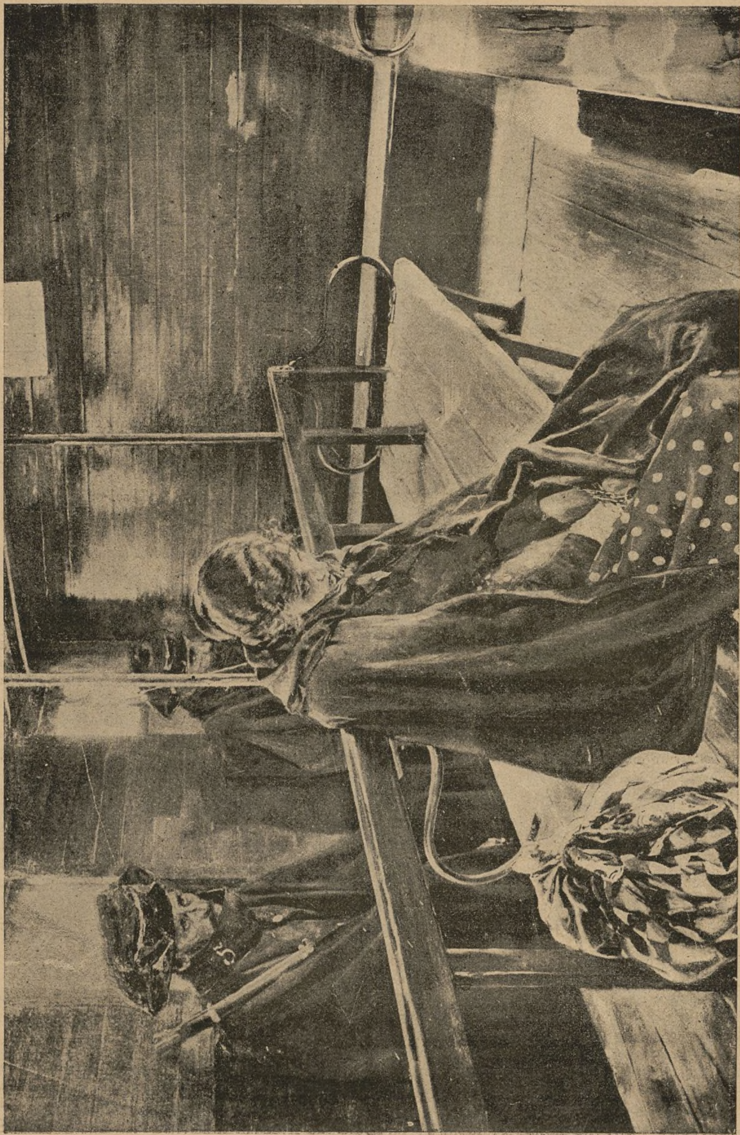
¡OTRA MARGARITA! (CUADRO DEL LAUREADO ARTISTA D. JOAQUÍN SOROLLA)