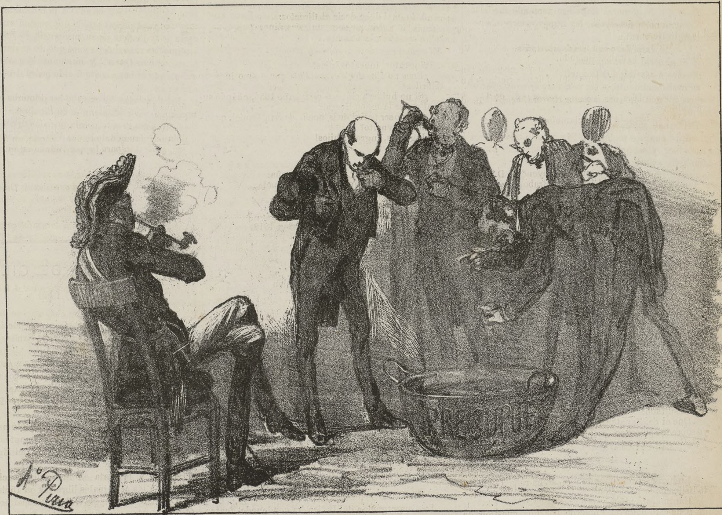
Un congreso unánime, efecto del Retraimiento.

—Vamos, niños, no seais pesados, venid á las urnas, que sino se va á acabar esto como el rosario de la Aurora; venid, hijos míos, venid, mirad que yo me he vuelto muy liberal.....En la cara se me conoce!