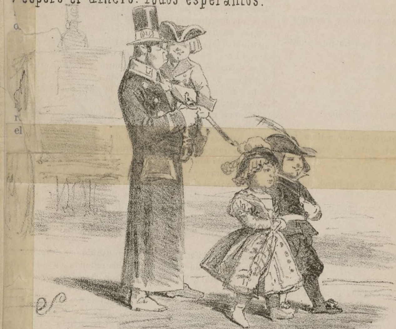
Desde el salon al Prado.

que aquellas nos esperan en el café. espero el dinero. Todos esperamos.