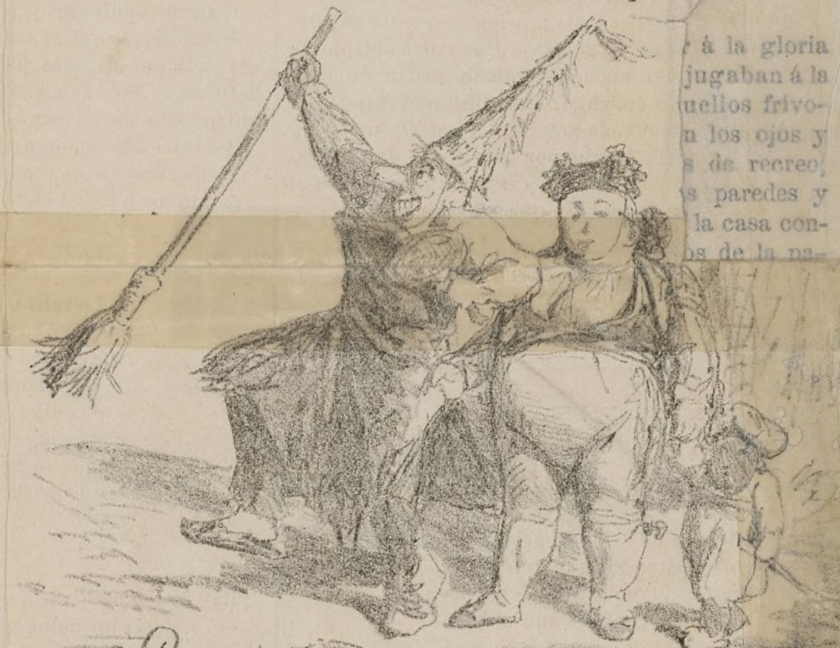
Desde la taberna al Canal.