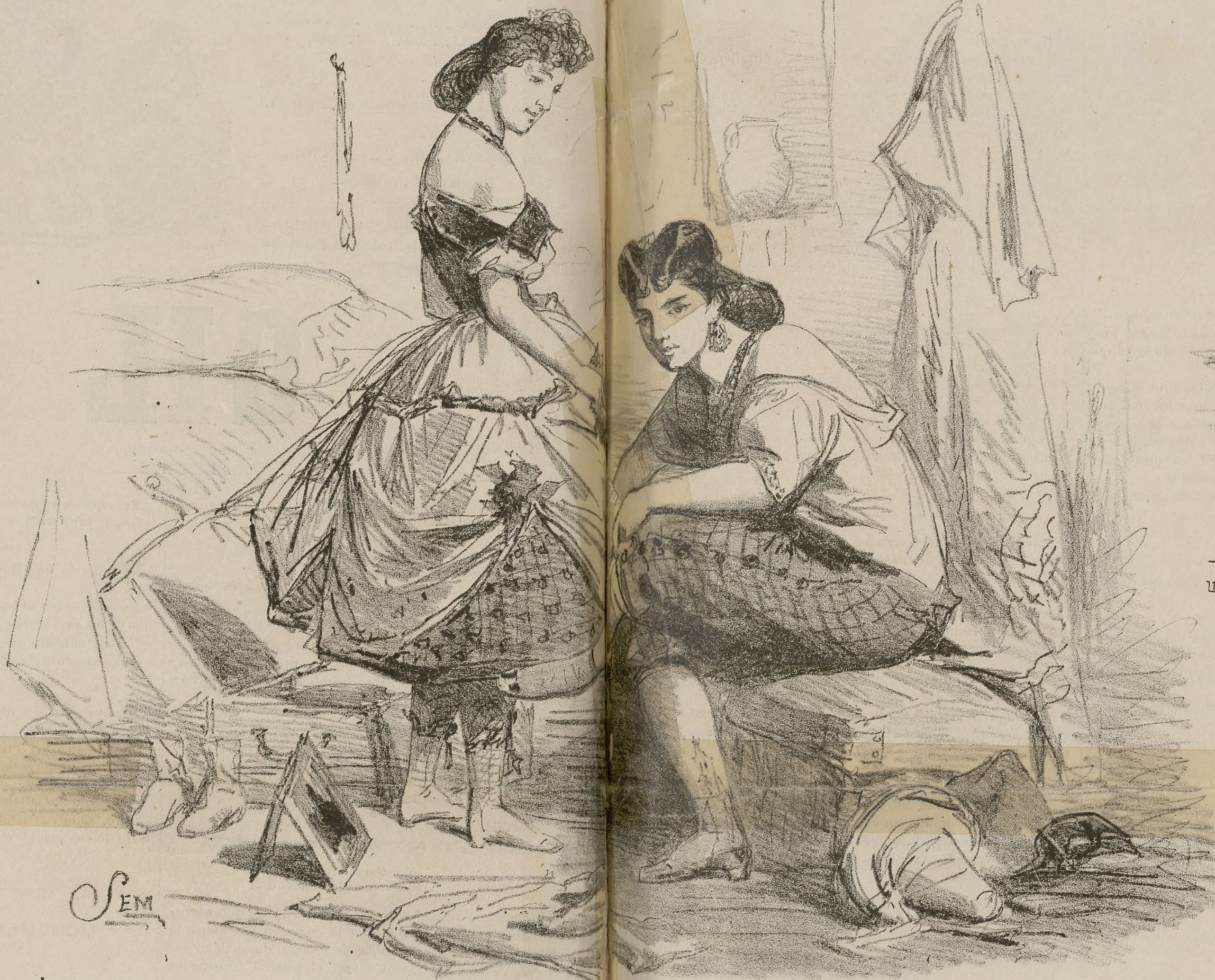
DESDE LA GU... Á CAPELLANES.

Por fin roba su alvedrio otra dama de gran brio.