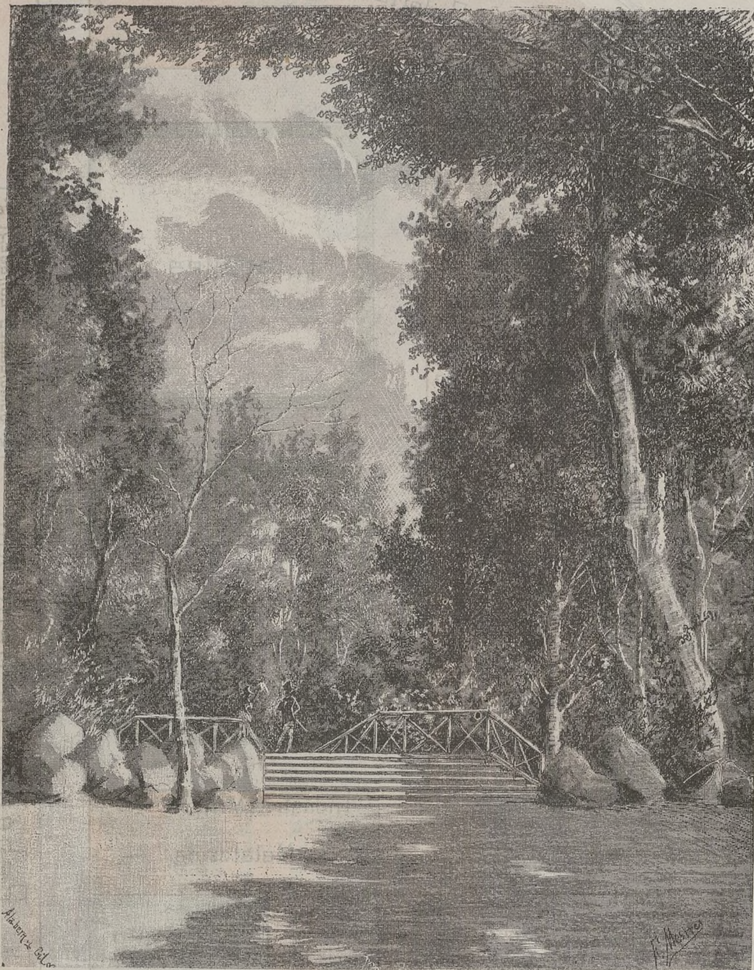
PUENTE PEQUEÑO DEL LAGO EN LOS JARDINES DEL PARQUE

agradable. El OBRERO debe procuraraún á costa de titánicos esfuerzos, desenvolver todo lo posible su inteligencia, hacerse cargo de la situación que ocupa entre sus semejantes, establecerse una ordenada distribución del tiempo, y sobre todo tener muchos deseos de saber, ver mucho, no perder ningún detalle, retenerlos todos en la imaginación, y dotar á su espíritu de una firme voluntad; la de penetrarlos. Lejos de considerar el trabajo como una cosa mecánica, debe verlo bajo un prisma más elevado. La perspectiva de llegar á ser dueño debe constantemente presentarse ante sus ojos. No debe jamás enorgullecerse, muy por el contrario, debe tener perfecto convencimiento de que los operarios más hábiles encuentran un maestro. Las excursiones colectivas, la contemplación de trabajos buenos y variados, son de gran utilidad al OBRERO; pero si esto es de difícil realización, hallará completa compensación en las Exposiciones. En ellas es donde el OBRERO podrá adquirir los conocimientos necesarios á su ramo sin explicárselo quizá. Los gobiernos, las asociaciones, las corporaciones, los grandes fabricantes é industriales, han comprendido bien la conveniencia de facilitar el ingreso de sus OBREROS en las exposiciones; tanto es así, que suelen delegar numerosos OBREROS, por lo común los más aventajados, para que las visiten y tomen las