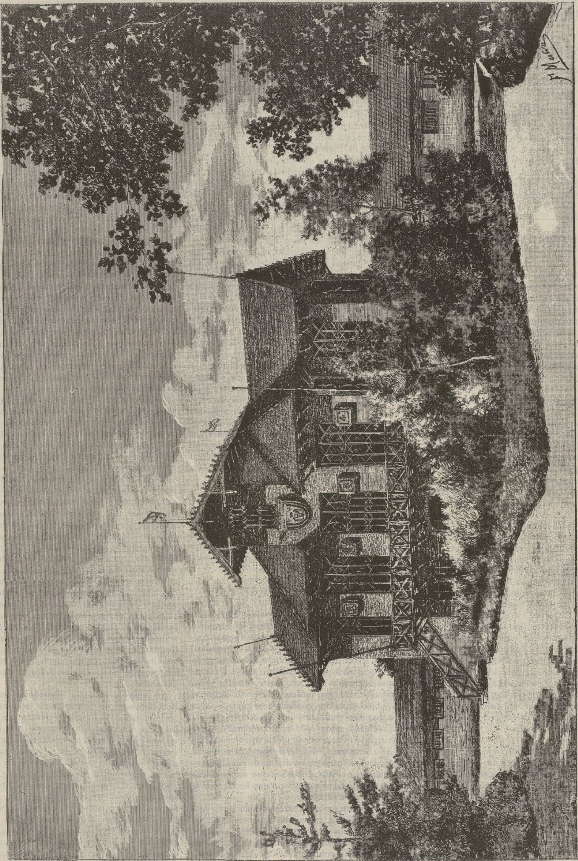
OFICINAS DE LA EXPOSICION UNIVERSAL EN EL PARQUE