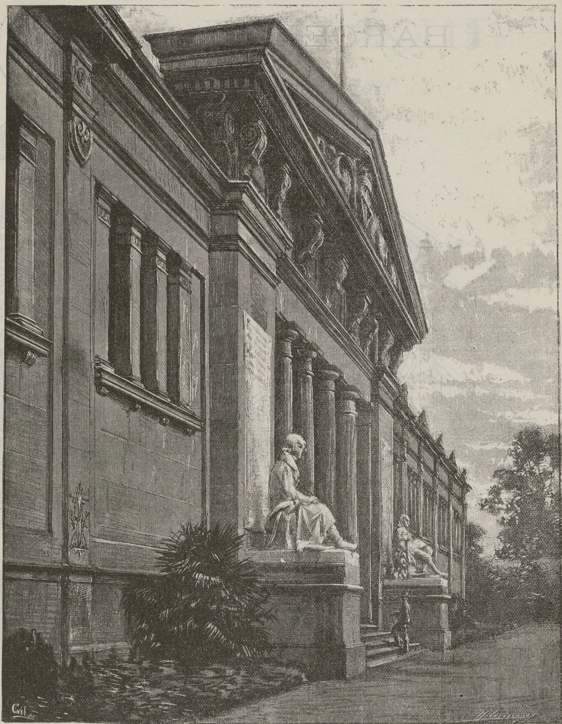
MUSEO MARTORELL — PARQUE DE BARCELONA