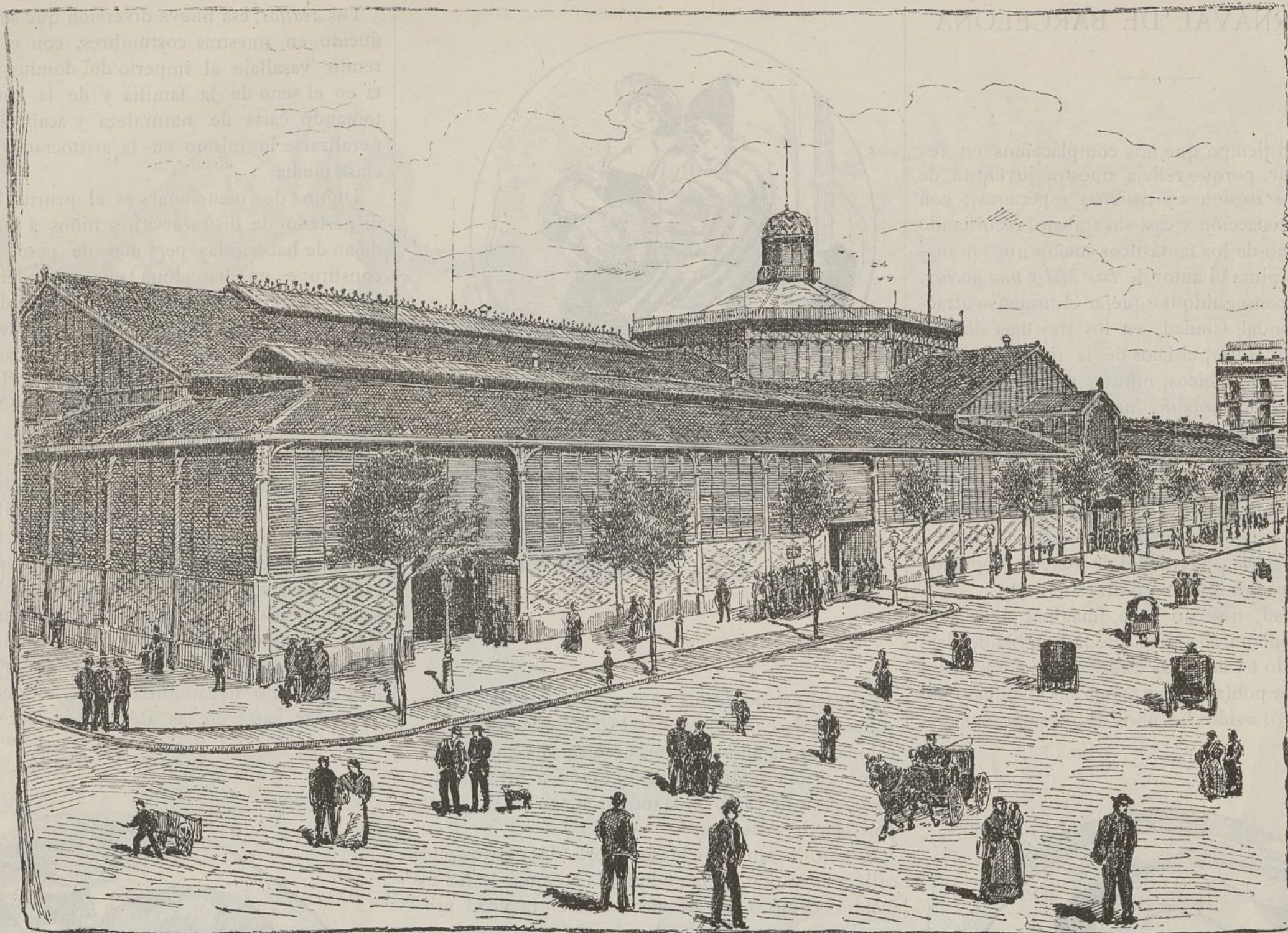
MERCADO DEL BORNE —BARCELONA