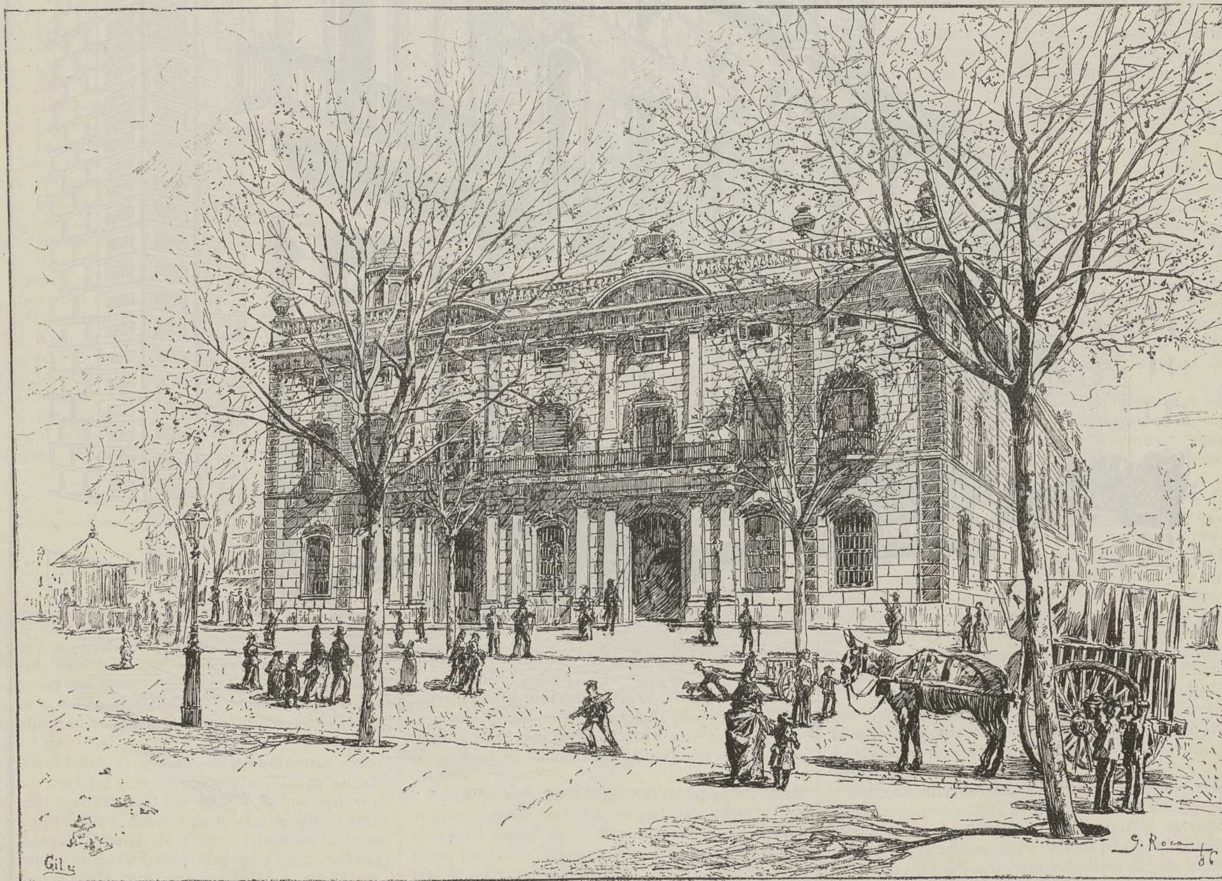
TESORERÍA DE HACIENDA — BARCELONA