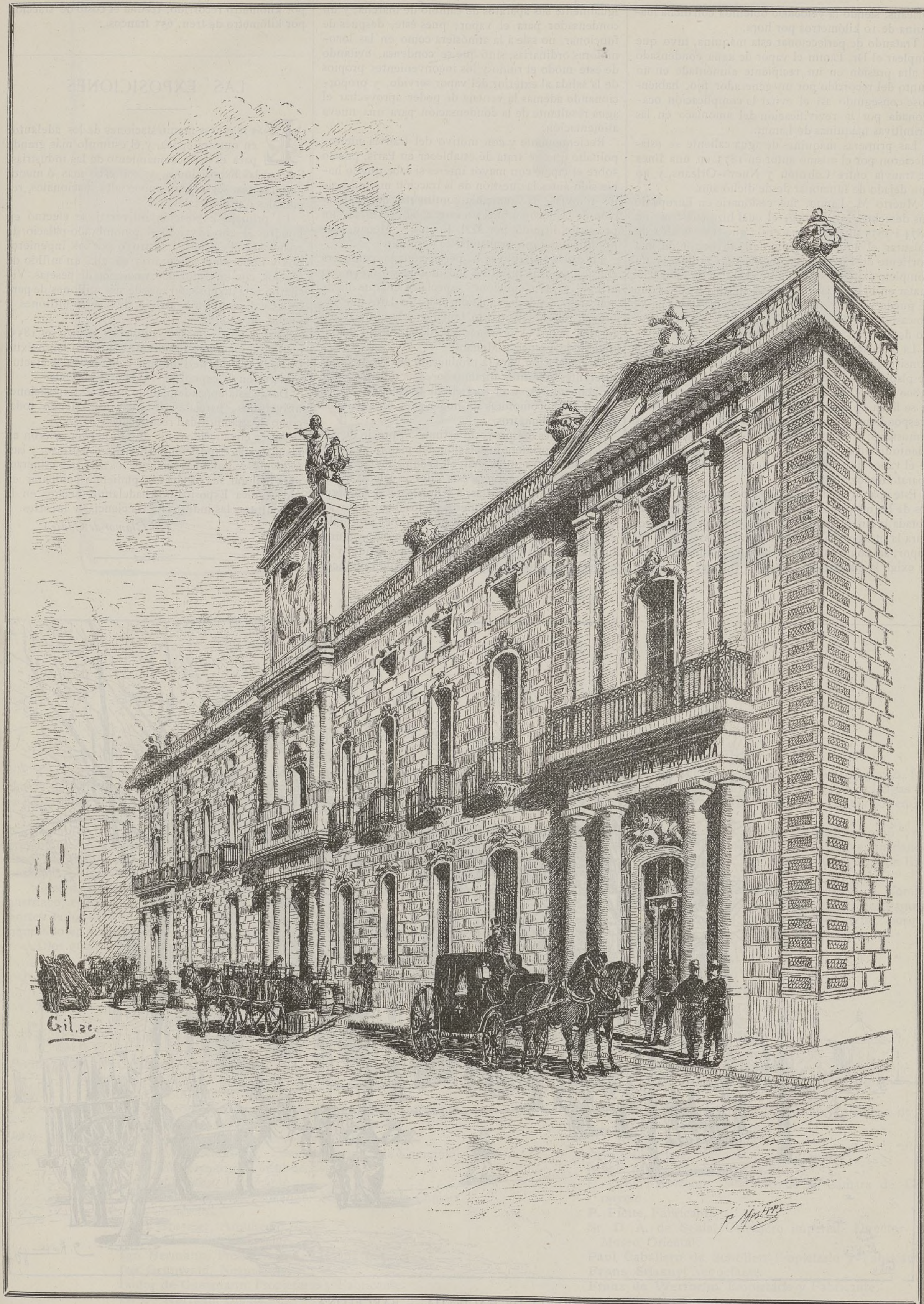
GOBIERNO CIVIL, ADUANA Y ADMINISTRACIÓN ECONÓMICA — BARCELONA