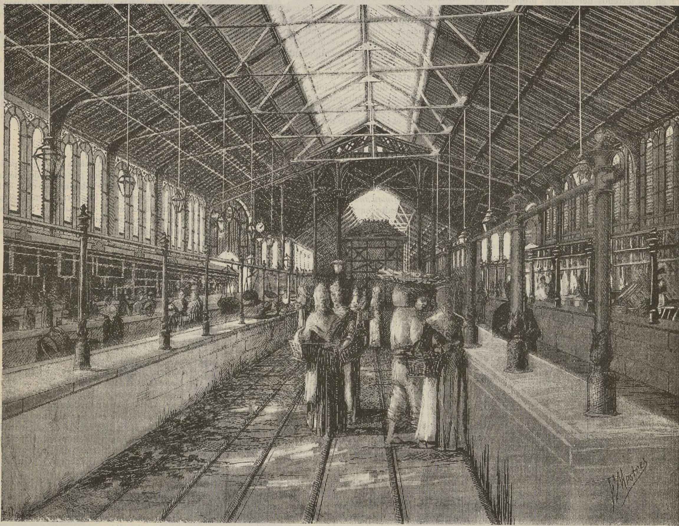
INTERIOR DEL MERCADO DE S. ANTONIO—BARCELONA

«Exposición Universal.—Teniendo que abrirse indefectiblemente la Exposición Universal de Barcelona el 15 de Setiembre próximo, y siendo de imprescindible necesidad que los objetos que á ella se envíen, lleguen allá con alguna anticipación para