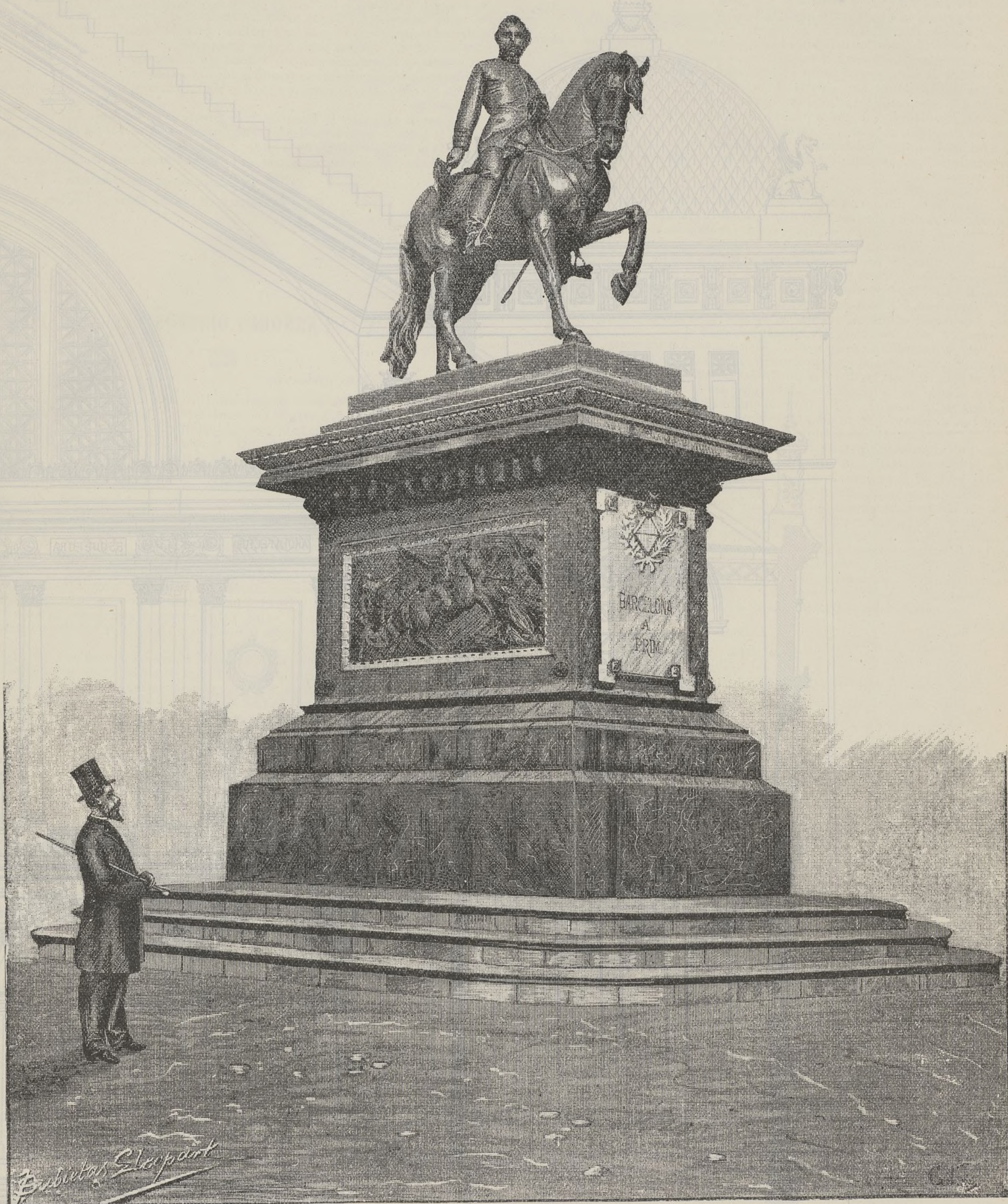
MONUMENTO A LA MEMORIA DEL ILUSTRE GENERAL PRIM, EN EL PARQUE DE BARCELONA

bradamente el sueldo que por su trabajo se les haya asignado. Aparte de que, en nuestro concepto, pocos de ellos hubieran aceptado el puesto que ocupan, acaso en perjuicio de sus intereses, si no estuviesen estimulados por el deseo de contribuir con su saber y fuerzas al éxito de una empresa tan difícil y gloriosa como nuestra próxima Exposición.