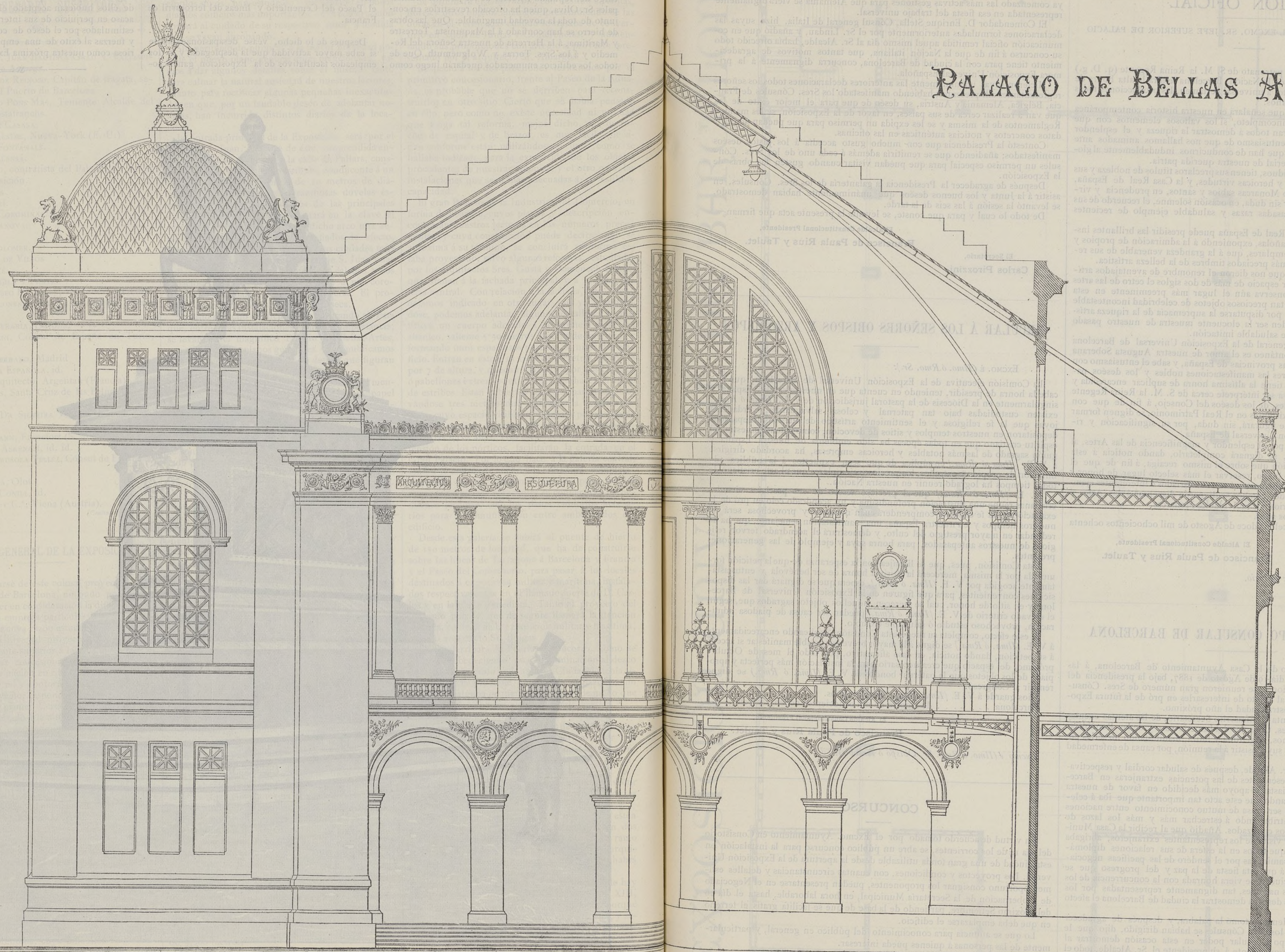
Detalles de fachada