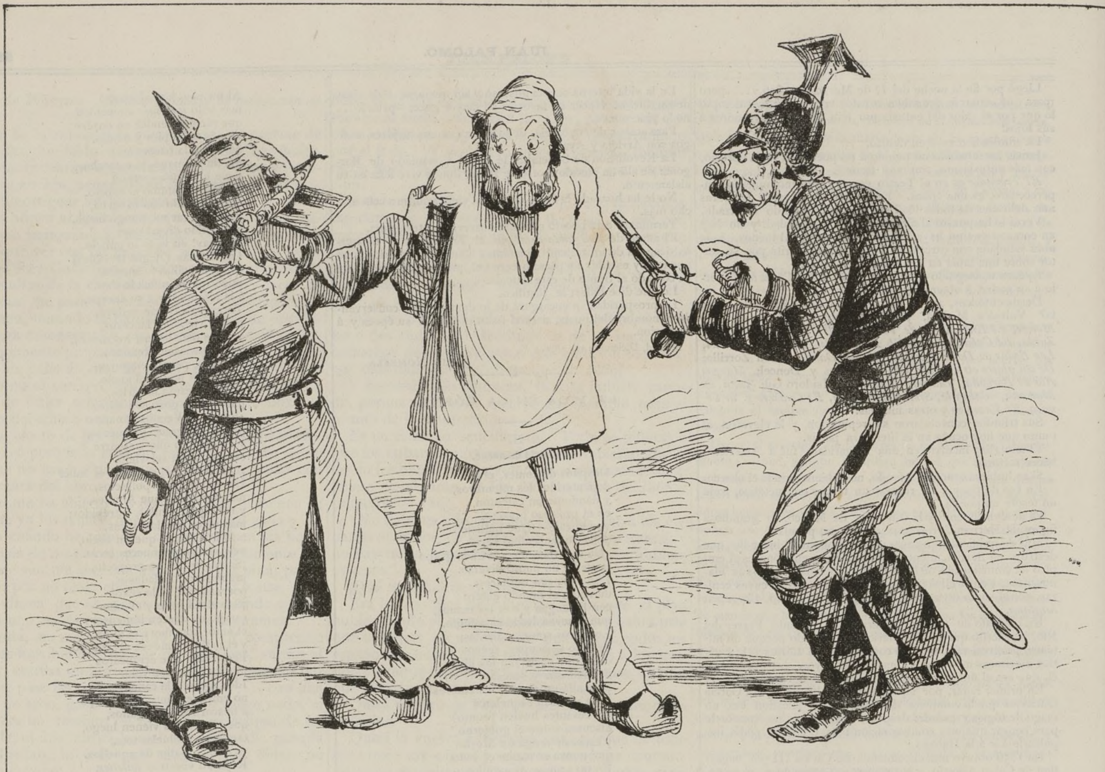
“El campesino que niegue auxilios á mis soldados, será fusilado.”—BISMARCK.