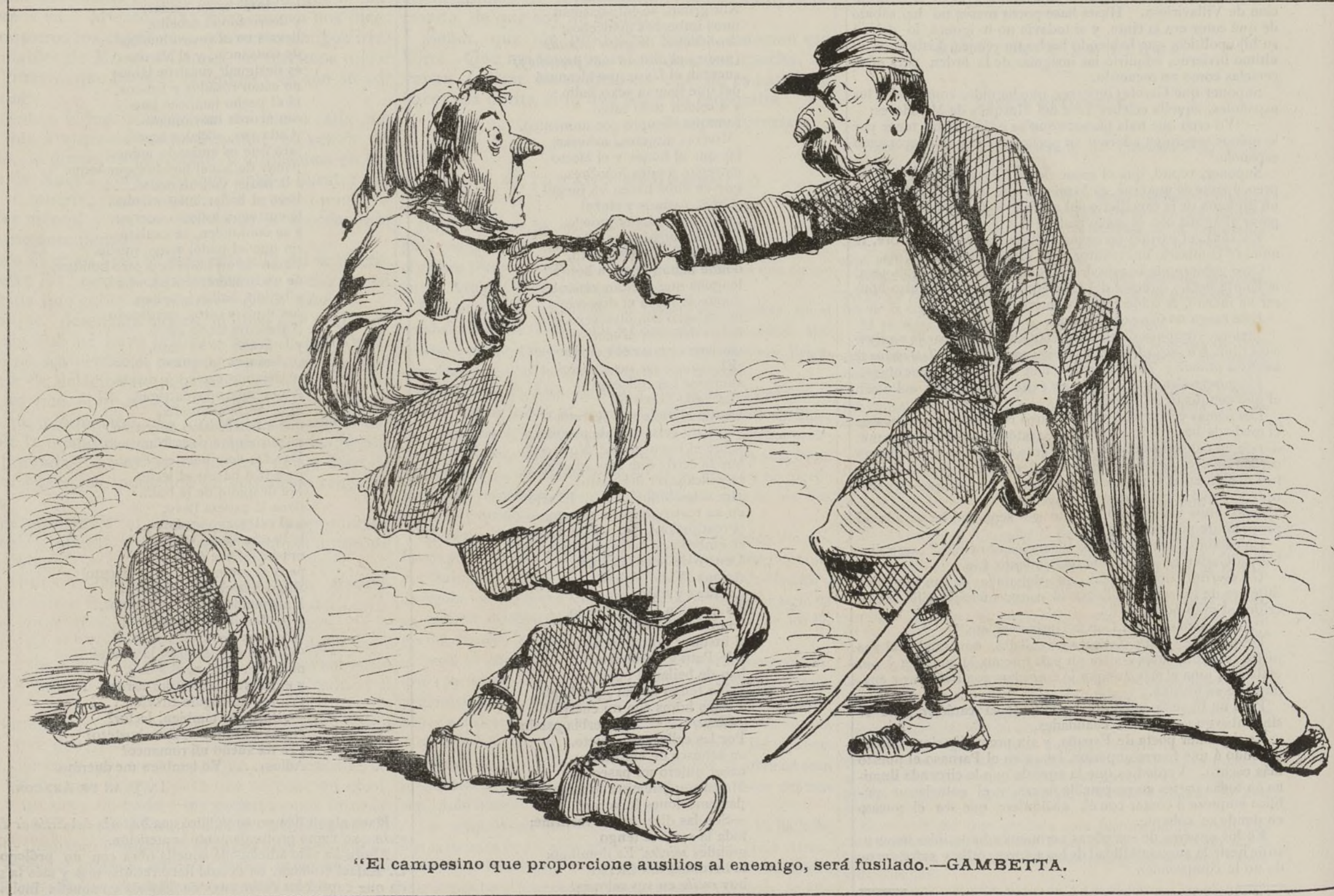
“El campesino que proporcione auxilios al enemigo, será fusilado.—GAMBETTA.