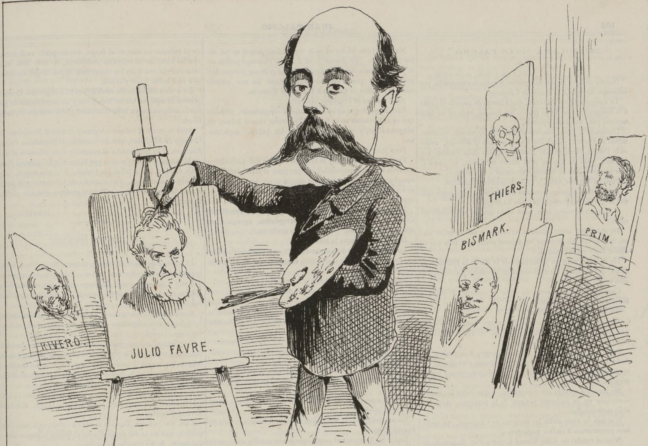
“La palabra construye como la arquitectura, esculpe como el buril, pinta como el pincel y canta como la música.”—CASTELAR.