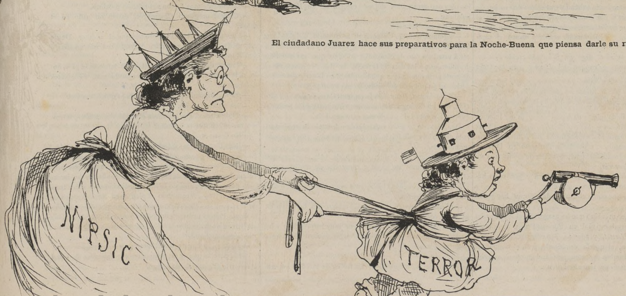
Ay! qué miedo!!!