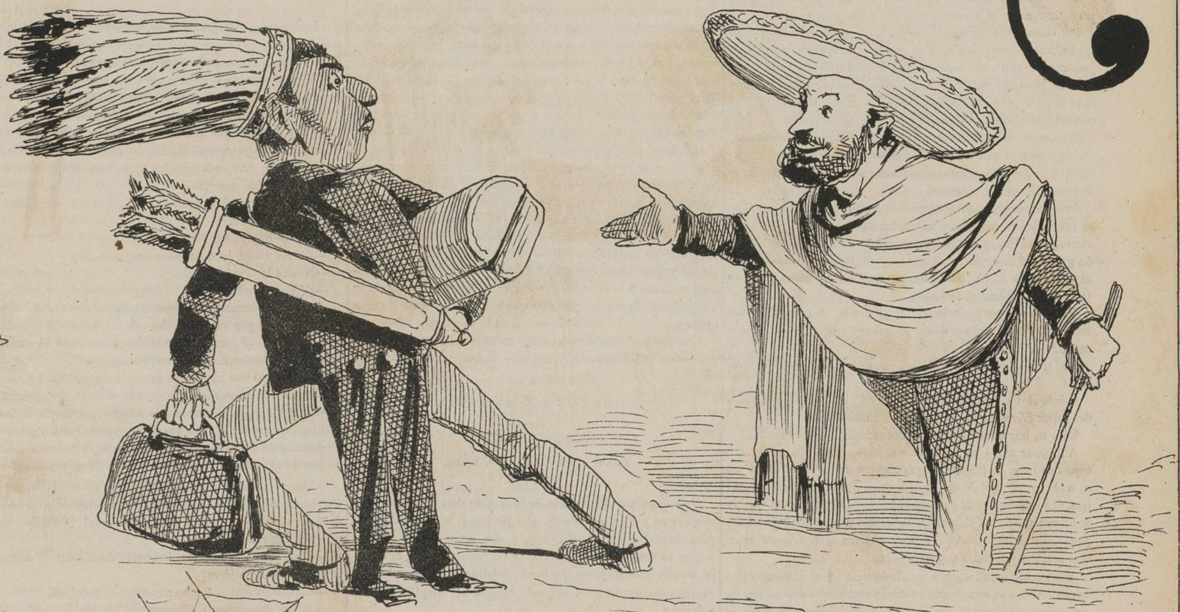
El ciudadano Juarez hace sus preparativos para la Noche-Buena que piensa darle su rival Porfirio Diaz.

-Compañeros! cenad si hay con que, divertios si hay como, y no temais, que mi esperitu estará siempre con vosotros.