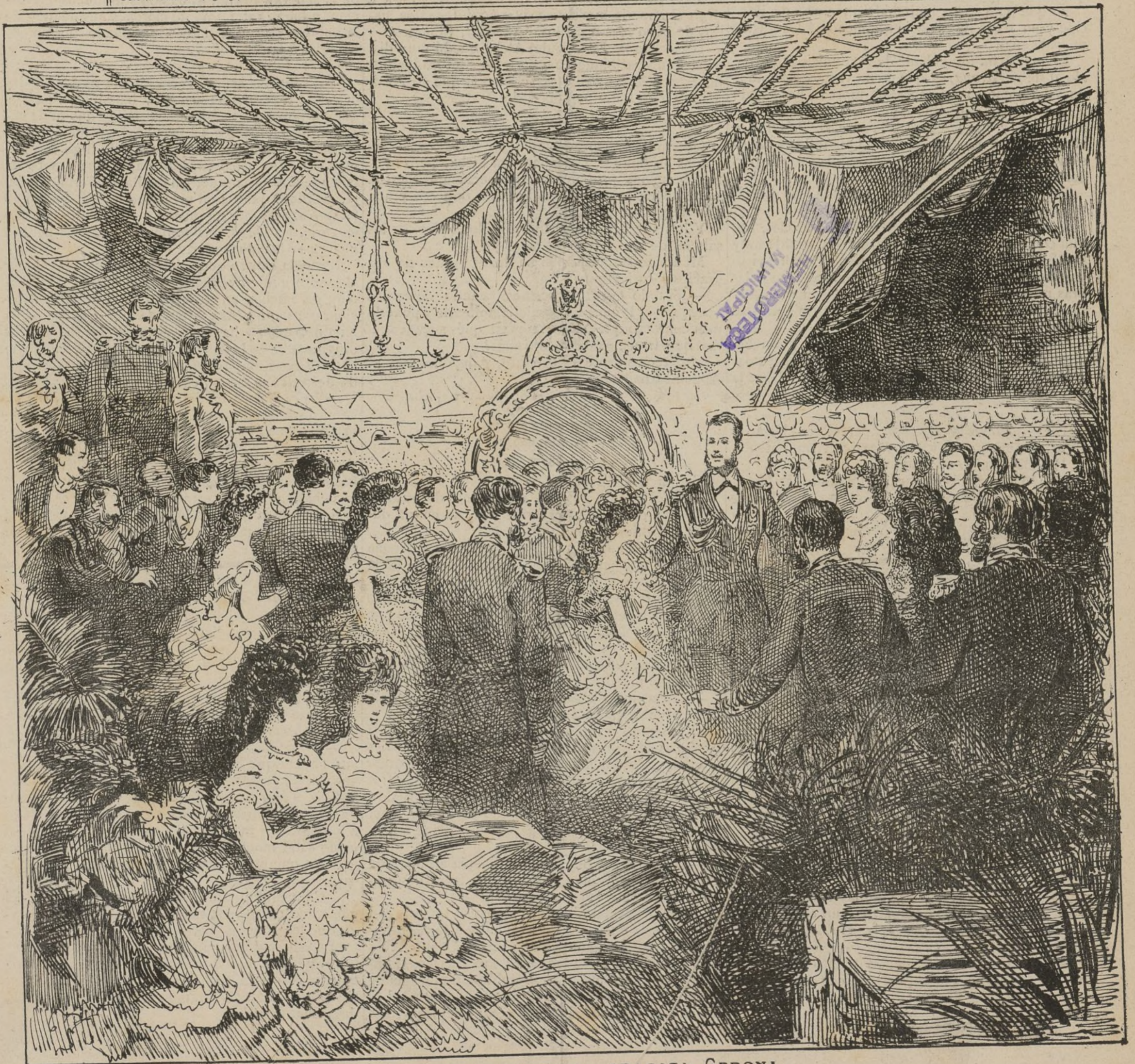
BAILE Á BORDO DE LA FRAGATA GERONA. (MARZO 6 DE 1872.)