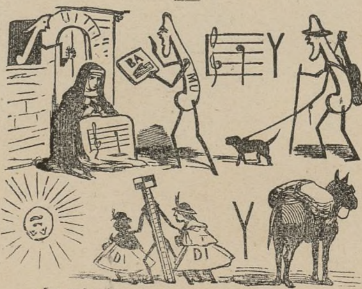
(La solucion en el número próximo.)

Establecimiento tipográfico de "La Propaganda Literaria."