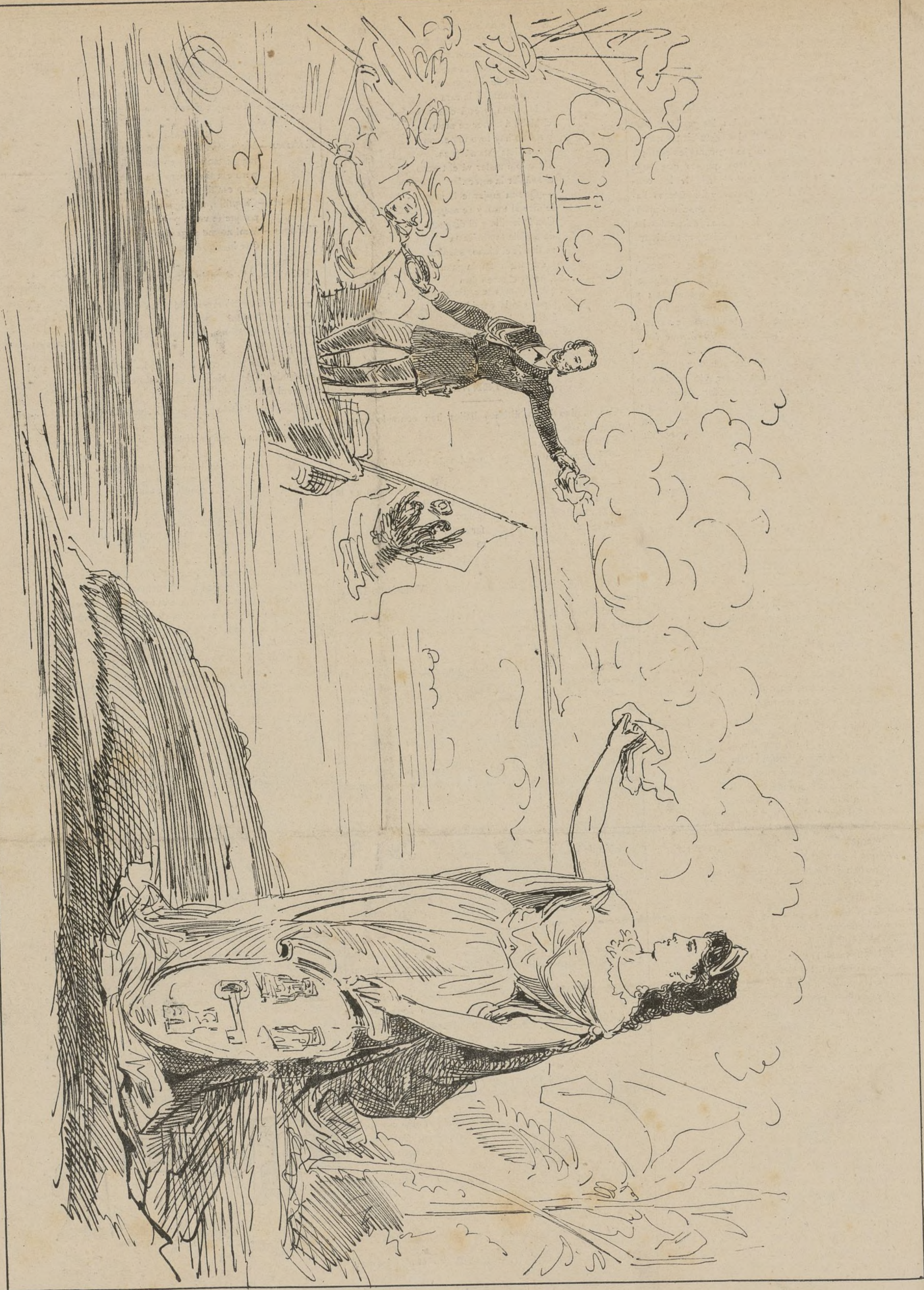
DESPEDEDIDA DEL PRÍNCIPE ALEJO.