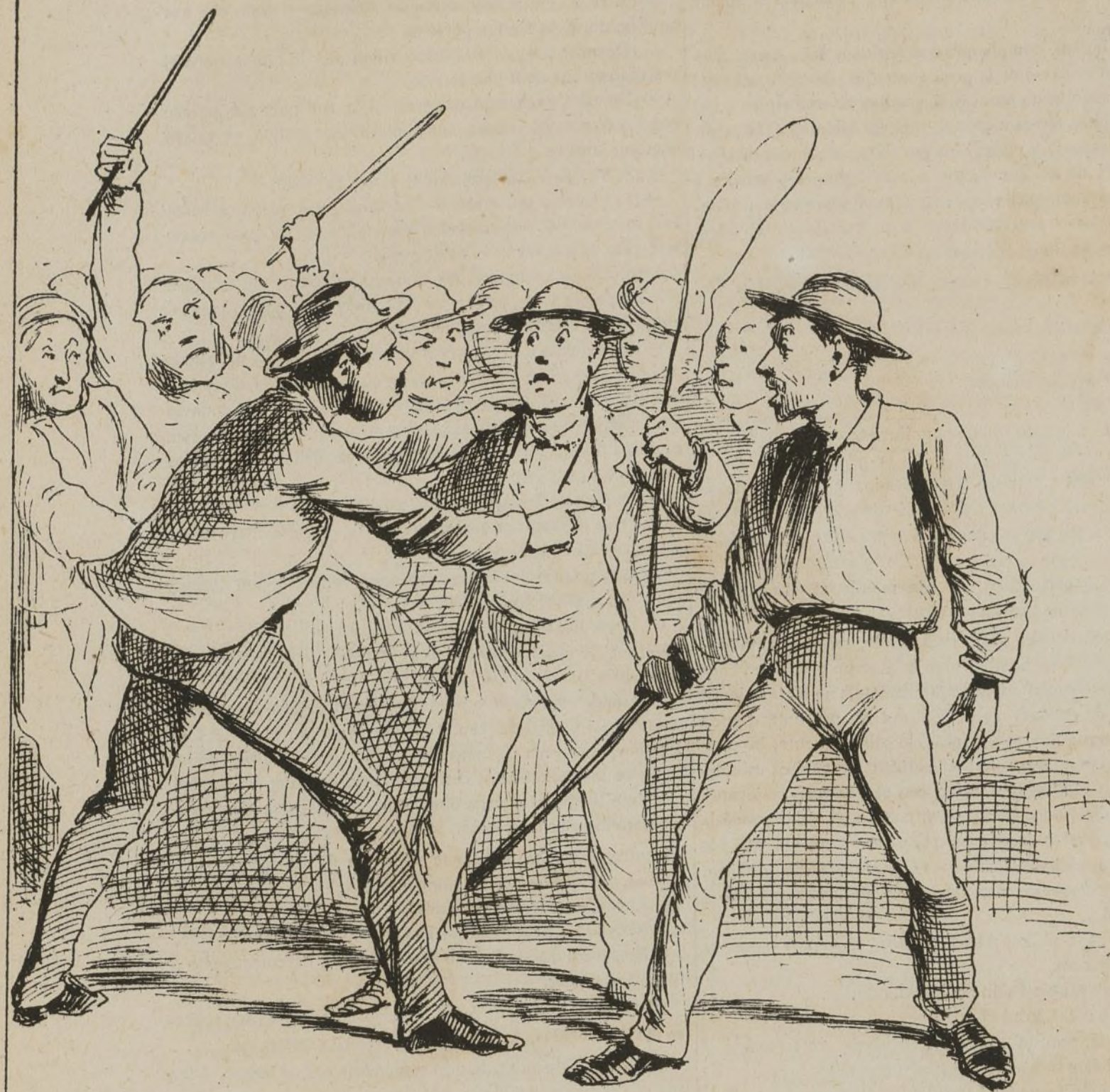
No era lo peor que unos no trabajaran, sino que se lo prohibieran á los otros.