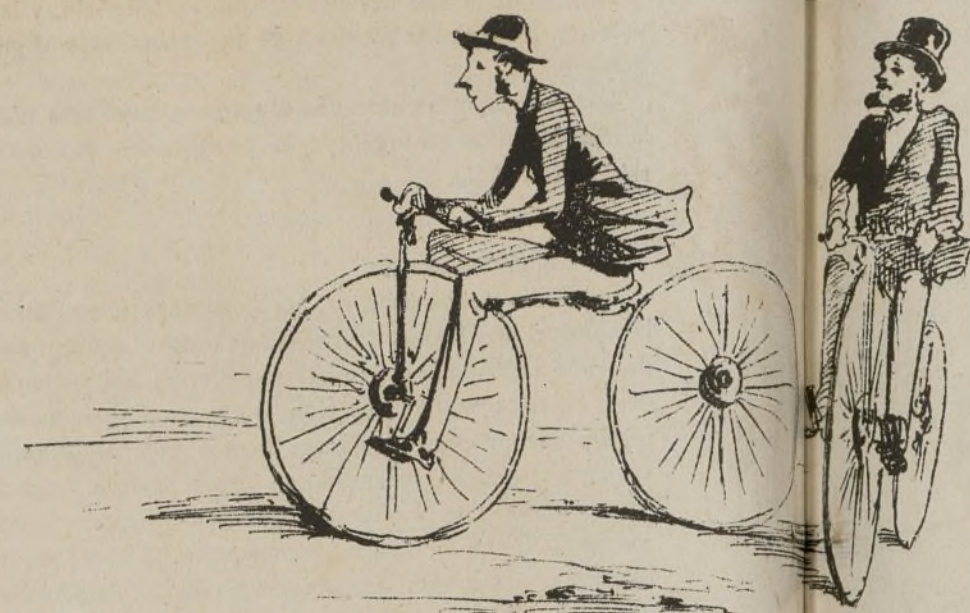
Por si acaso volviera á ocurrir, aconsejamos á los hombres de negocios que ensayen este ejercicio económico como elegante.