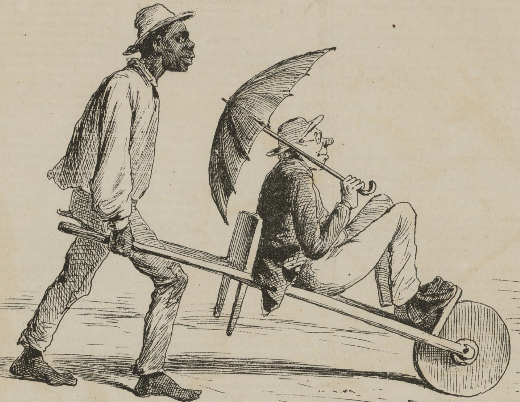
Los filósofos podrían elegir este otro sistema.