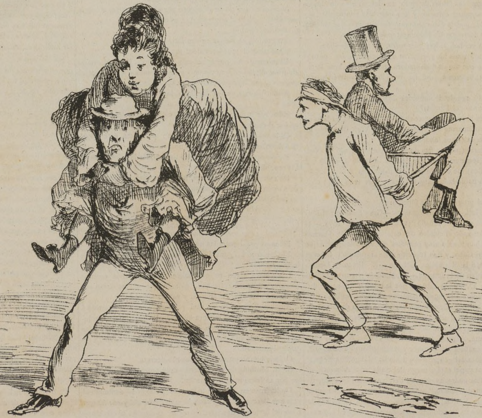
A no ser que prefieran alguno de estos otros dos.