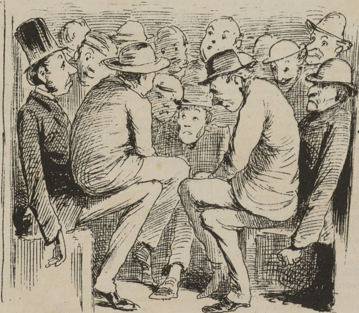
El interior de las guaguas presentaba un aspecto pintoresco.