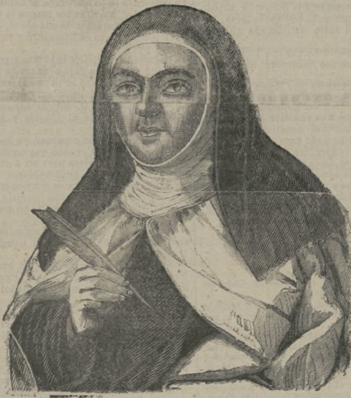
Teresa de Jesús.

Y como está acostumbrado á estas visitas ma- tutinas, continúa, sin darse prisa, los oficios hasta el fin. Al llegar á este punto distingue media docena de lobos colocados en espera al lado del primero, y les grita con formidable voz que les hace huir á la des- bandada: Ite, missa est.