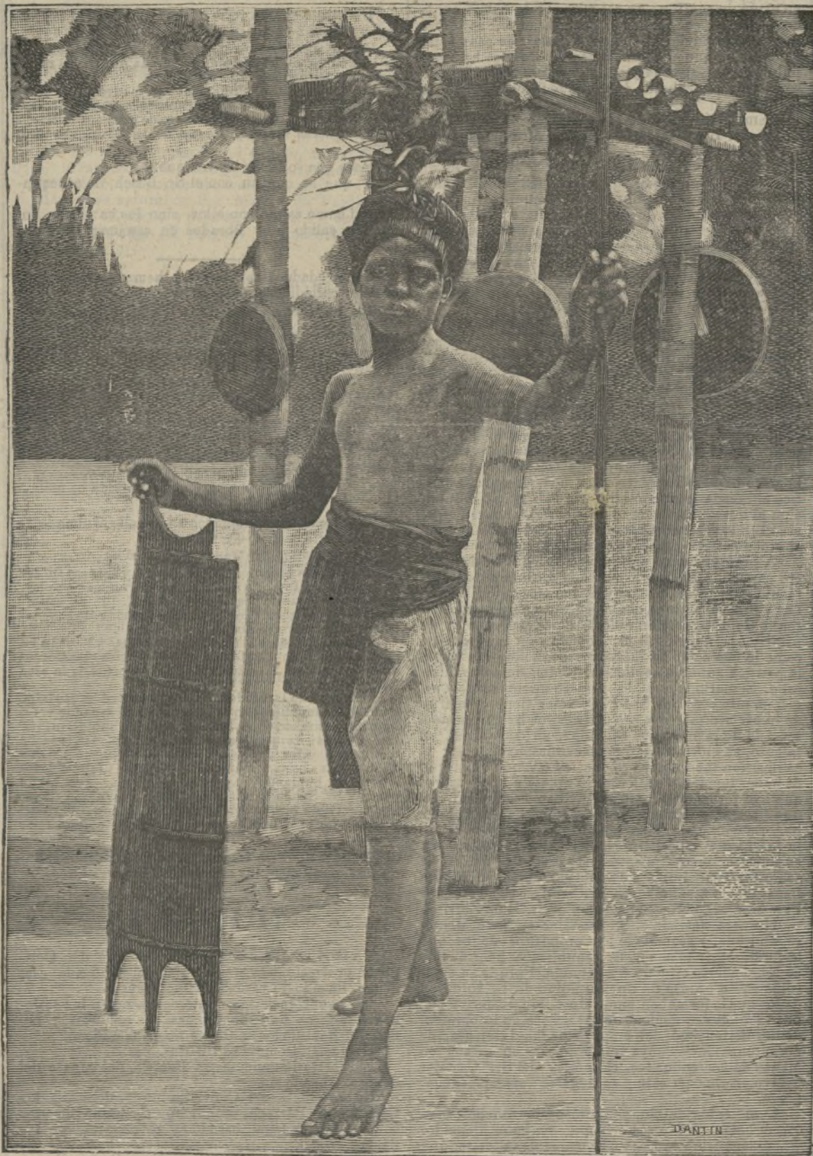
El Negrito de la Exposición.