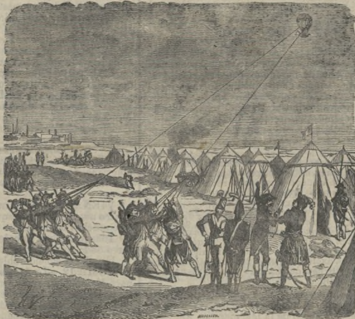
La batalla de Fleurus.

Vaya, la luz del faro titila ya como una estrella