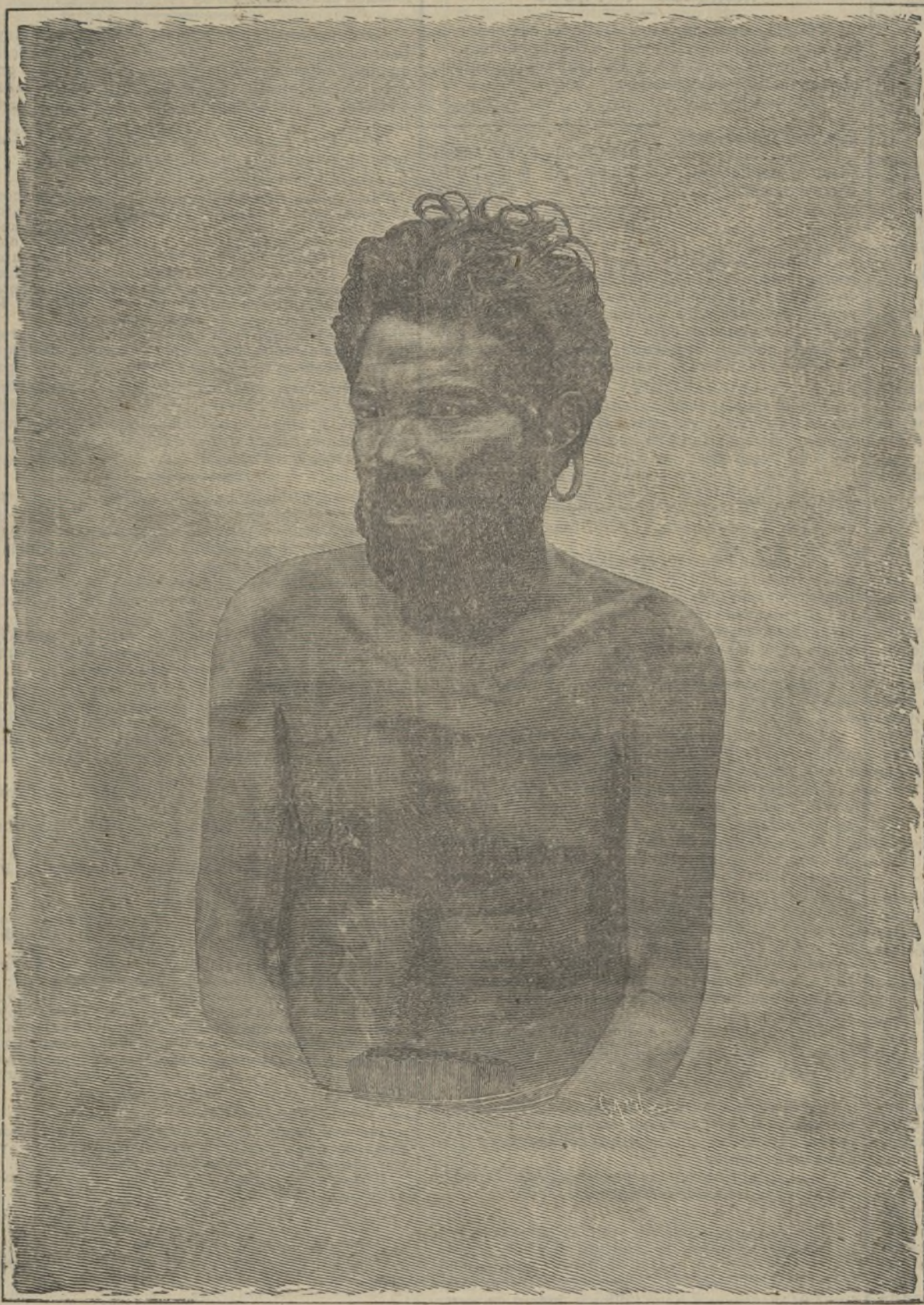
«Pe-aripis» el carolino.

Son principalmente pescadores y marineros hábiles é intrépidos. Se alimentan del producto de