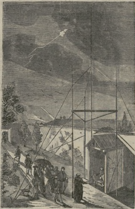
El experimento de Marly.

Los órganos olvidarán un momento su grandeza como el abuelo olvida sus años, para hablar con el ale-