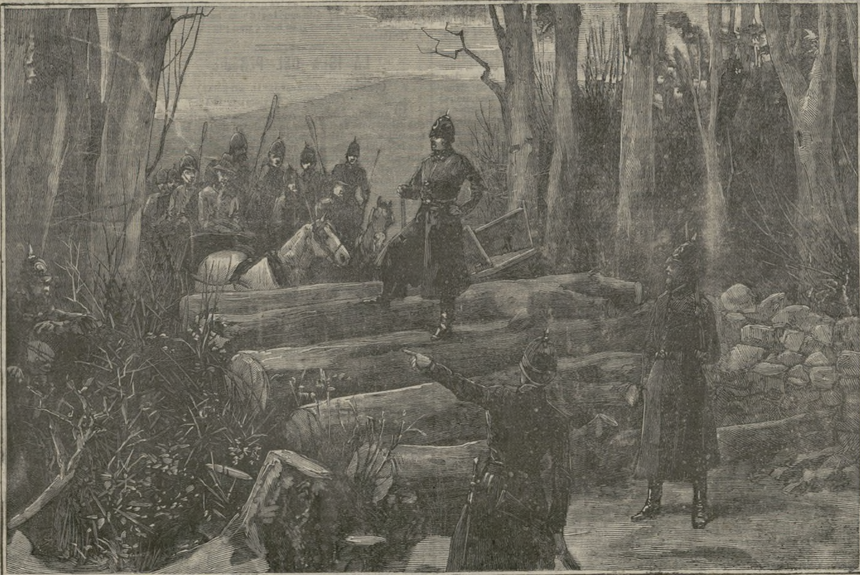
Barricadas en Irlanda.

Ahora bien: los peces están provistos de nervios motores; pero no tienen nervios sensitivos. Luego no sienten.