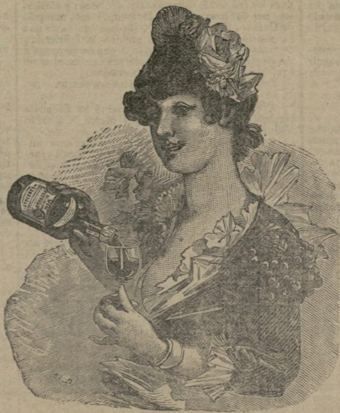
El VINO de BUGEAUD ha obtenido la recompensa más alta en la Exposición de Higiene de la Infancia de Paris (1887)

P. LEBEAULT & C ta , 5, Rue Bourg-l'Abbé, PARIS