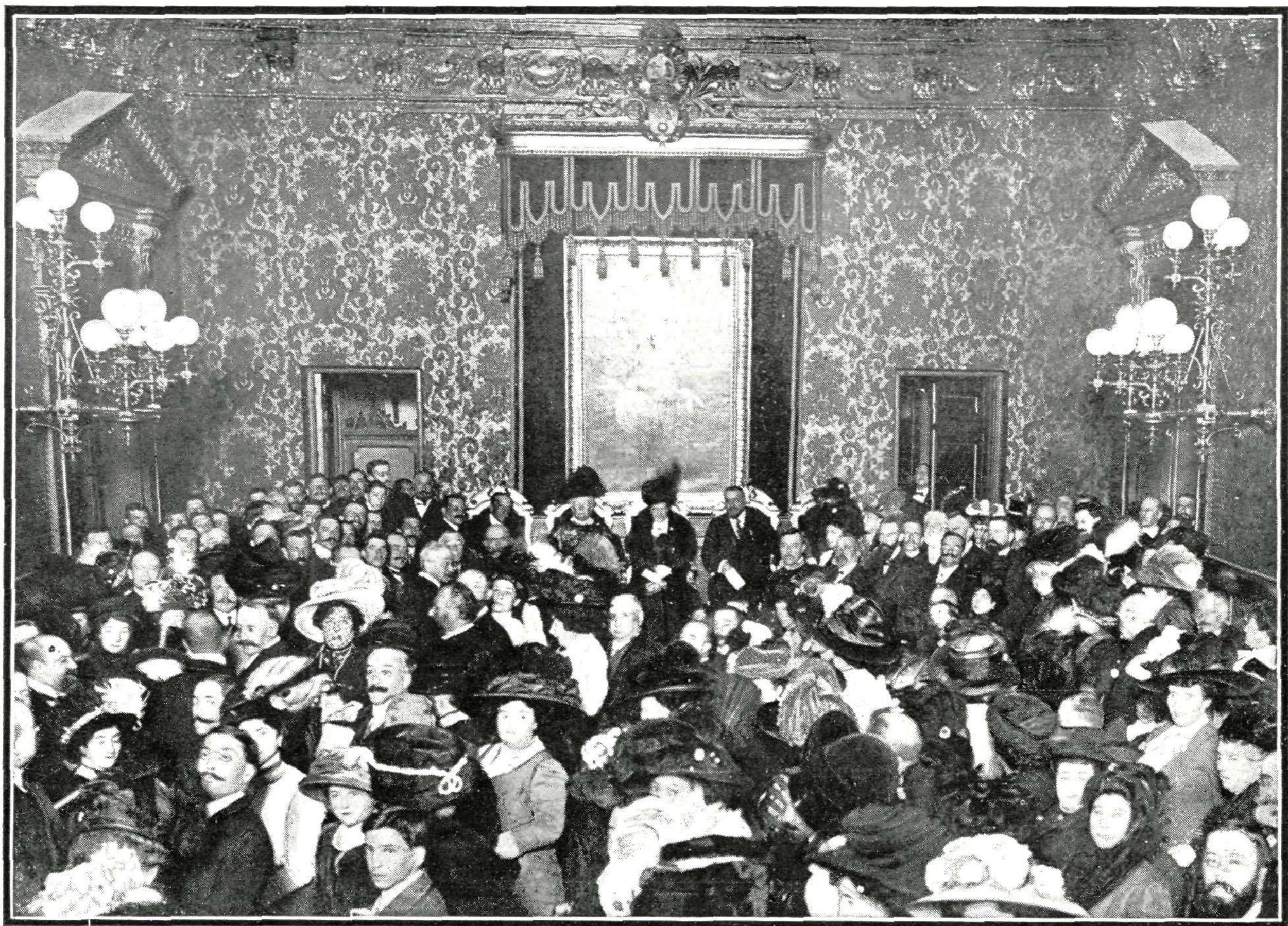
Recepción en honor de los delegados del IV Congreso Internacional para la represión de la trata de blancas, verificada en el salón de actos del Ayuntamiento de Madrid el día 26 del pasado con asistencia de las infantas D. a Isabel y D. a Paz