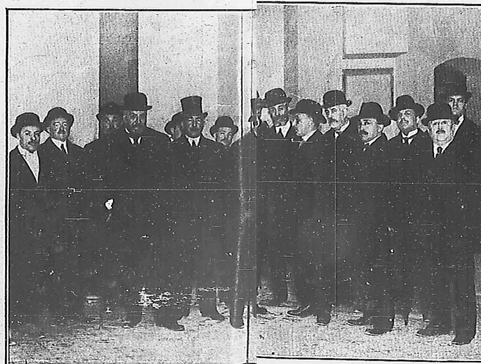
El ministro de la Gobernación, el director de Correos y otras personalidades visitando el edificio