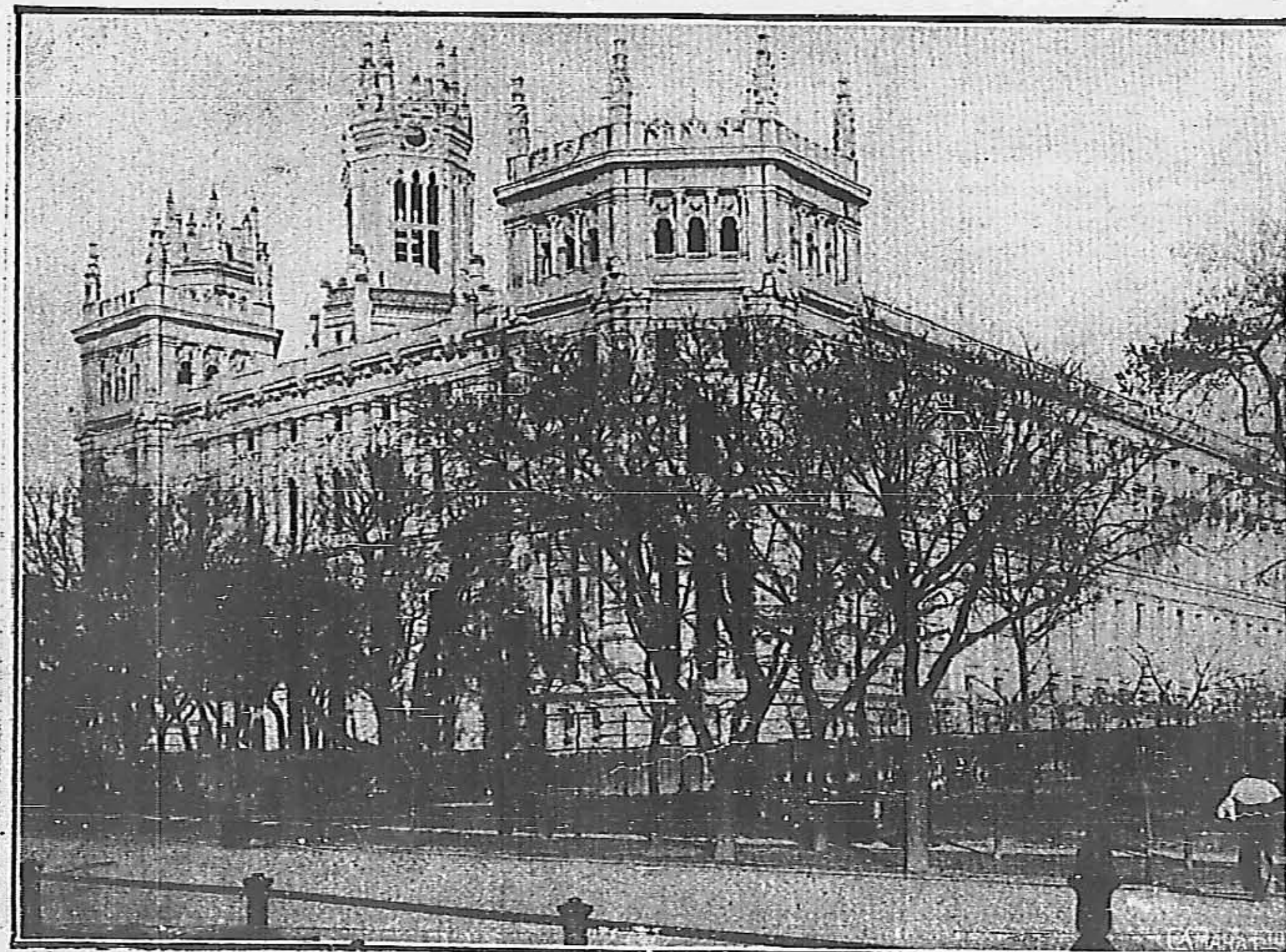
Fachada de la Casa de Correos, que dá al Salón del Prado