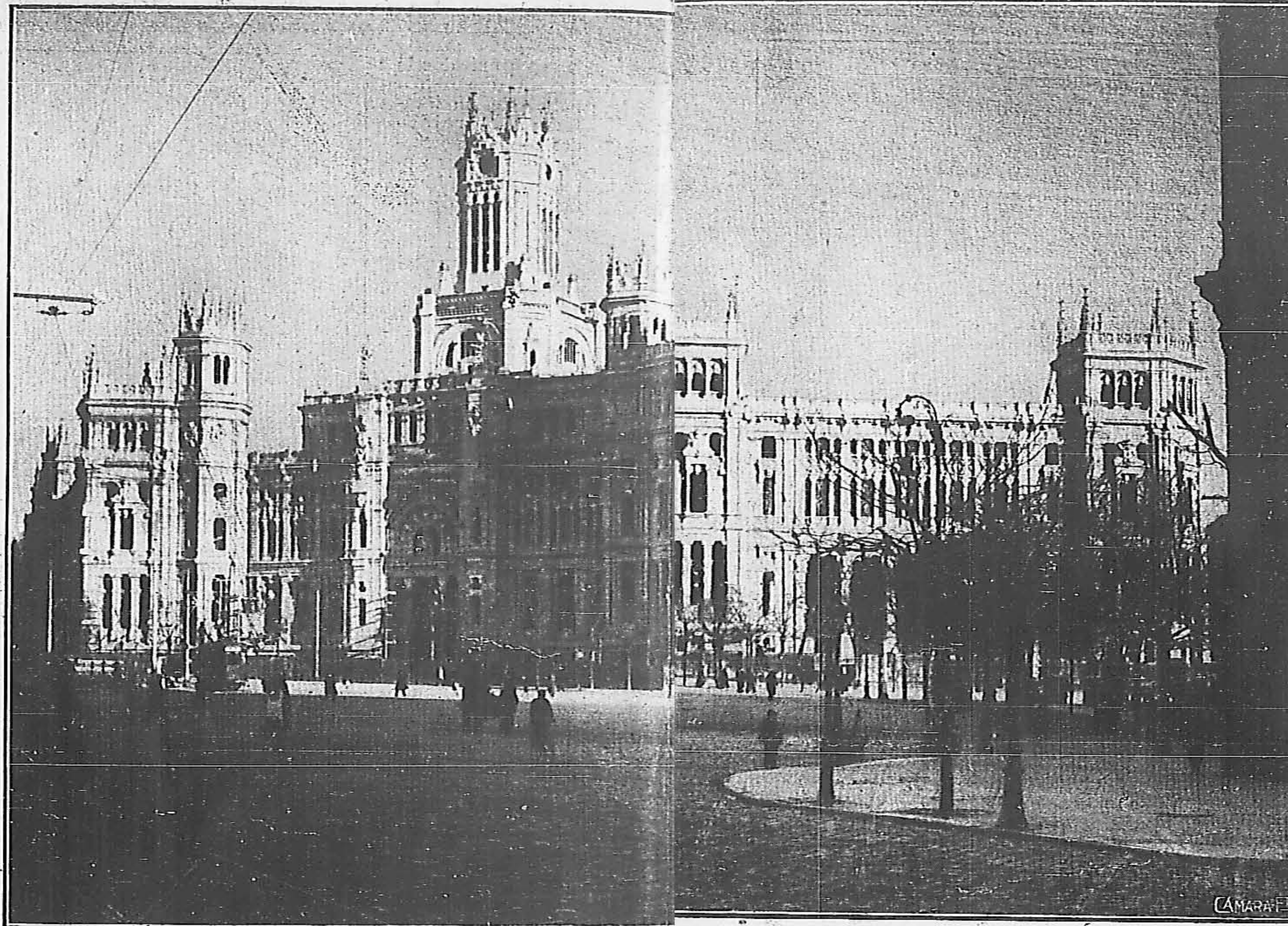
Fachada principal de la nueva Casa