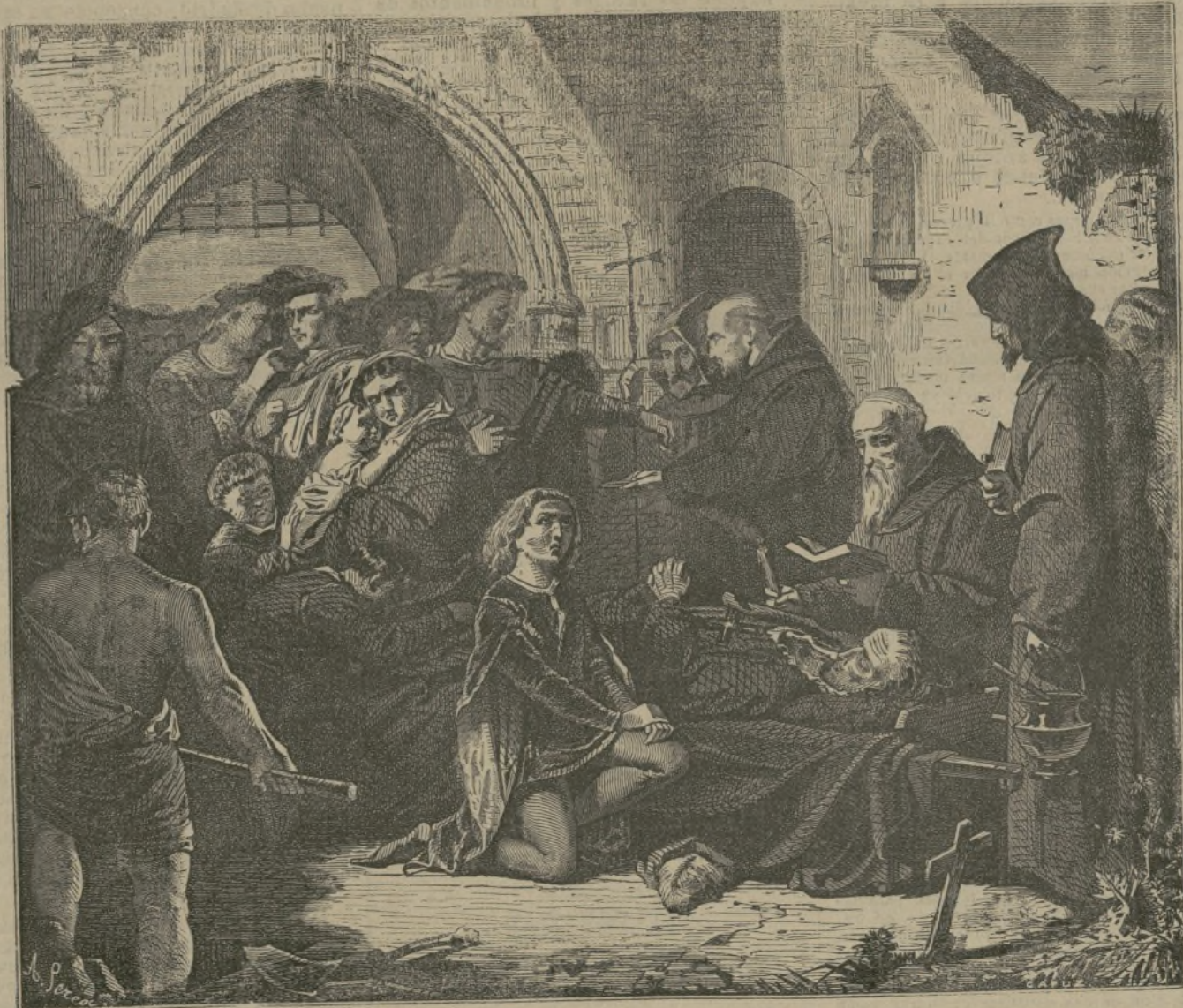
Entierro de D. Alvaro de Luna.

Se pueden obtener muchos kilogramos á la vez del hermoso sulfuro de zinc fosforescente, tratando por el amoniaco una disolución neutra de cloruro de zinc puro, redisolviendo en un exceso de amoniaco el precipitado formado, precipitando por completo, sin el menor exceso, el óxido de zinc amoniacal por el hidrógeno sulfurado, calentando hasta el blanco, con las precauciones necesarias en el crisol de barro refractario colocado en el interior de otro de grafito cubierto de carbón, el sulfuro de zinc amorfo perfectamente lavado y secado al abrigo de cualquier impureza.